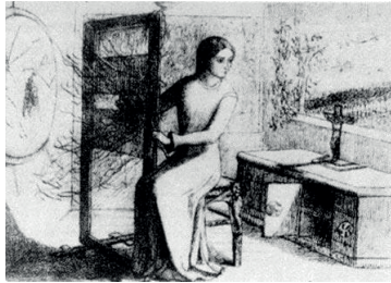
F. 1: Elizabeth Siddal, Shalott Lady'si , 1853, kağıt üzerine mürekkepli kalem, 16.5 x 22.3 cm, Maas Gallery, Londra

“...Tepeden baktı Camelot'a, Ağ uçtu gitti ve süzüldü alabildiğine, Ayna boydan boya kırıldı, 'Lanet yağdı üzerime' diye bağırdı Shalott Lady'si...” 5