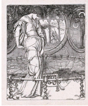
F. 3: William Holman Hunt, Shalott Lady'si, 1857, ahşap baskı, 9.4 × 8.1 cm, Metropolitan Museum, New York, ABD

görürüz. Lady'nin saçları vahşice dalgalanırken büyük dokuma tezgahı onu kaplamış gibidir. Saçları 1850'deki illüstrasyonundaki gibi bağlı değildir, dokumanın yüzen ipliklerine eşlik etmek için özgürce salınır . 16 Lady neredeyse tüm resmi kaplayacak boyuttadır. Aynanın yanında 1850'deki aynı isimli eserinde olan küçük madalyonlar yerine aynanın sağında arkasında hilal ile betimlenmiş, çarmıha geriliş sahnesi görülür. Lady'nin devasa boyutu kadınların yoğun cinsel enerjisinin metaforu olarak yorumlanabilir. Aynı zamanda Hunt, bu devasalıkla kendi öyküsünü, sanatçı otoritesini koymak istemektedir. 17