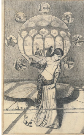
F. 2: William Holman Hunt, Shalott Lady'si , 1850, kağıt üzerine siyah tebeşir ve mürekkepli kalem, 23.5 x 14.2 cm, National Gallery of Victoria, Melbourne, Victoria, Avustralya

Pre-Raphaelite Kardeşliğinin kurucularından William Holman Hunt'ın Shalott Lady'si öyküsüyle ilgili birden fazla çalışması olmuştur. Bu öyküyle ilgili tüm betimlerinde Tennyson'ın The Lady of Shalott adlı şiirinden esinlenen William Holman Hunt, 1850'de yaptığı Shalott Lady'si (F.2) adlı kağıt üzerine siyah tebeşir ve mürekkepli kalem çalışmasında lanetin başladığı anı tercih etmiştir.