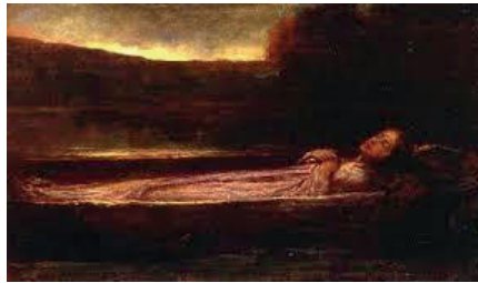
F. 10: John La Farge, Shalott Lady'si , yak. 1862, tuval üzerine yağlı boya, 20.48x35.84 cm, The New Britain Museum of American Art

Pre-Raphaelite Grubu sanatçılarından bir hayli etkilenen John La Farge, 1862 civarı yaptığı Shalott Lady'si (F.10) tablosunda kahverengi kızıl siyah tonlarıyla matem havasını derinleştirmiştir. Gün batımının kızılığıyla ışık kaynağı sağladığı Lady'si kayıkta çoktan ölmüştür. İssiz bir nehrin ortasında yüzen kayık dışında öyküye dair başka bir detay yer almamaktadır.