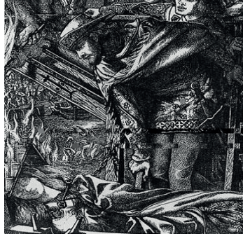
F. 6: Dante Gabriel Rossetti, Shalott Lady’si , 1857, kağıt üzerine ahşap baskı, 9.3 × 8 cm, Museum of Fine Arts, Boston, ABD

“...İskeleyle çıkmışlardı Şövalye, kasabalı, lord ve hanım Kayığın pruvasında okudular adını, Shalott Lady’si Kim bu? Ne işi var burada? Yakındaki ışıklı sarayın soylu, mutlu sesleri sustu; Korkudan haç çıkardılar, Camelot’taki tüm şövalyeler: Fakat Launcelot, bir süreliğine düşüncelere daldı Ve dedi ki: ‘Güzel bir yüzü var...’ 27