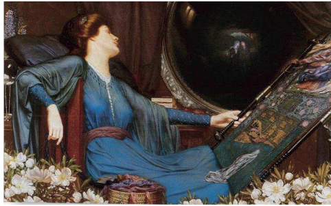
F. 14: Sidney Harold Meteyard, Yarı-Gölgelerden Bıktım Dedi Shalott Lady'si , 1913, tuval üzerine yağlı boya, 76 x 114 cm, Özel Koleksiyon

Kadınların haklı özgürlük mücadelesini destekleyen Sidney Harold Meteyard (1868-1947) Birmingham Arts and Crafts Grubu üyesidir. Tennyson'ın The Lady of Shalott şiirinden esinlenen sanatçı, şiirde geçen Lady'nin 'yarı-gölgelerden bıktım' sözlerini söylediği anı betimlemeyi seçmiştir. Yarı-Gölgelerden Bıktım Dedi Shalott Lady'si adlı yağlı boya eserinin (F.14) diğer Shalott Lady'si betimlerinden farklı olarak tenselliği yaşamak için duyduğu stres vurgusu yerine Lady'nin oturduğu koltukta kendine güvenir ve erotik bir poza sahip olduğu gözlerden kaçmaz. Elbisesinin yumuşak kumaşı vücudunun şeklini ortaya sererken kafasının bir yana yönelmişliği, resmin gölgeleriyle zıtlık gösteren boynunun narin beyaz tenini açığa vurur. Gözleri bir rüyada gibiymişçesine kapalıdır ve bize bakmaz, bu da onu hem ulaşılmaz hem de savunmasız bir hale getirir. 34 Victoria Dönemi Shalott Lady'si imgelerindeki saf ve gizemli temsillerinden farklı olarak Meteyard'ın bu resminin modernliğe geçiş dönemi olan Edward Dönemi kodlarına uyduğu fark edilir. Korsesiz, günün modasına uygun olarak yüksek bel kıyafetiyle Lady, ilerici düşünce ve kadın özgürlüğü mücadelesinin etkilerini sunmaktadır.