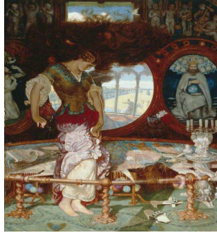
F. 4: William Holman Hunt, Shalott Lady'si, 1886-1905, pano üzerine yağlı boya, 44.4 x 34.1 cm, Manchester Art Gallery, Manchester, İngiltere

kafası ve tavus kuşu tüylü kıyafeti gölgeler içinde kalmıştır. Uzun elbisesi vücudunu sıkıca sarmıştır. Lady güçlü ve resmin büyük bir bölümünü kaplar şekilde sahneye kocaman yerleştirilmiştir. Model, sanatçının karısıdır. Resimdeki nesnelerin anlamları izleyiciyi birçok soruyla baş başa bırakmıştır: ikonalar, süsenler, sfenks biçimli kaide üzerinde bir lamba, güvercinler, dağınk çiçekler, çiçekli vazo, kırmızı renkli eteği, çıplak ayağı, parlak rengarenk yün topları. 18 Resimde bir tane kadın figürünün yılan başlı bir figüre basarken betimlenişi Adem ve Havva'ya bir göndermedir ve de Havva'nın Adem'i baştan çıkarışı Lady'nin günahkar rolü ile desteklenmiştir. Jan Van Eyck'ın Arnolfinilerin Düğünü 'nden ilham alan sanatçı, ayakkabıları odanın ve yaptığı işin kutsallığı mahiyetinde Lady'nin ayağından çıkarılmış gösterir. Aynı zamanda ayakkabıların yanındaki süsenler Lady'nin bekaretine istinaden betimlenmiş olup, yerlere saçılmış olması da Lady'nin Launcelot'a olan aşkı uğruna bekaretini ve saflığını umursamayıp harekete geçmesini simgeler.