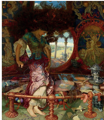
F. 5: William Holman Hunt, Shalott Lady'si, 1886-1905, tuval üzerine yağlı boya, 187.9 x 146 cm, Wadsworth Athenaeum Museum, Hartford, Connecticut, ABD