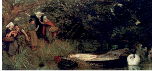
F. 12: Arthur Hughes, Shalott Lady'si, 1873, tuval üzerine yağlı boya, 32.5 x 53.2 cm, National Gallery of Art Museum, Londra

Arthur Hughes'un yağlı boya eseri Shalott Lady'si (F.12) ise kayıkta Camelot'a doğru sürüklenirken kasabalıların ölüsüyle karşılaşp korktukları ve şaşırdukları anı gösterir. Lady izleyiciye dönük betimlenmiştir. Sahne güneşli bir günde akan bir nehir, çimenler, sazlıklar, söğüt ağaçları ile bezenmiştir. Ölmek üzere olan Lady'nin ağzı hafif aralık belki de son şarkısını fısıldamaktadır. Nehirde çıplak ağaçların, sazlıkların gölgesinde sürüklenen bu genç kızın Camelot'a doğru sürüklendiğine ya da Shalott'tan geldiğine dair bir emare yoktur. Öyle ki insan bu kıza ne olduğunu merak etmeden duramaz. 33