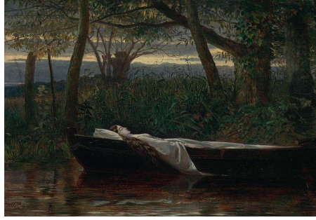
F. 11: Walter Crane, Shalott Lady'si, 1862, tuval üzerine yağlı boya, 24.1 x 29.2 cm, Yale Center for British Art, ABD

Aynı isimli (F.11) bir başka tablo da Walter Crane'e (1845-1915) aittir. 1862 tarihli tablosu John La Farge'ın betimi gibi karamsar bir atmosfer taşır. Sık ağaçlık ve sazlıklarla çevrelenmiş nehrin ortasında kırık beyaz uzun elbisesiyle Lady solgun yüzüyle ölmüş izlenimini verir. Masum yüzüyle Lady izleyicide derin bir acıma duygusu uyandırır.