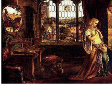
F. 9: William Maw Egley, Shalott Lady'si , 1858, tuval üzerine yağlı boya, 88 x 100.7 cm, Sheffield City Art Galleries, İngiltere

William Maw Egley, Shalott Lady'si (F.9) adlı yağlı boya resminde Shalott'ı kapatıldığı kulede pencereden dışarı bakarken sakin bir halde betimlemiştir. Dış dünyayı gördüğü aynasından atının üzerinde Launcelot yansır. Sanatçı, dokuma tezgahı, şaşaalı mobilyalar, çok bölmeli pencereleri ile farklı bir bakış açısı sunmaktadır.