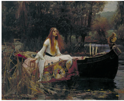
F. 8: John William Waterhouse, Shalott Lady'si , 1888, tuval üzerine yağlı boya, 153 x 200 cm, Tate Britain, Londra, İngiltere

Bu öykünün birkaç farklı versiyonunu betimleyen John William Waterhouse'ın 1888'de yaptığı Shalott Lady'si (F.8) yağlı boya tablosu bu konuda en bilinen resimlerindedir. Tennyson'ın The Lady of Shalott şiirini kaynak alan sanatçı Lady'yi, Camelot'a doğru ölüme doğru sürüklenirken betimlemiştir. Lady, Orta Çağ'a ait uzun kollu; saflığı ve bekareti simgeleyen beyaz elbisesiyle sakin bir halde kayıkta oturur şekilde gösterilirken sadece kendisi değil su üzerinde adeta her şey sürüklenir durumdadır. Yumuşak ton kullanımı, doğanın melankolik atmosferi, loş ışık, sessiz bir sonbaharın ölü yaprakları, kırılmış kamışlar, nehre bıraktığı zincir, kayığın pruvasında sadece biri yanan üç kandil ve çarpmıha gerilmiş İsa imgesi Lady'ye son yolculuğunda eşlik etmektedir. Atmosfer karamsardır, ağız hafif aralık olarak resmedilen Lady son şarkısını mırıldanır. Sanatsal başarısının temsili olan dokuması kayıkta asılı durmaktadır. 30 Dokumadaki iki küçük sahnenin birinde kendisinin Camelot'a kayıktaki yolculuğu ve ikincisinde başka şövalyelerle Sir Launcelot'un betimlendiği sahne yer alır.