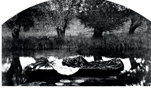
F. 13: Henry Peach Robinson, Shalott Lady'si , 1861, albüm baskı 30.4 x 50.8 cm, The Royal Photographic Society, Bath, İngiltere

Kadınların haklı özgürlük mücadelesini destekleyen Sidney Harold Meteyard (1868-1947) Birmingham Arts and Crafts Grubu üyesidir. Tennyson'ın The Lady of Shalott şiirinden esinlenen sanatçı, şiirde geçen Lady'nin 'yarı-gölgelerden bıktım' sözlerini söylediği anı betimlemeyi seçmiştir. Yarı-Gölgelerden Bıktım Dedi Shalott Lady'si adlı yağlı boya eserinin (F.14) diğer Shalott Lady'si betimlerinden farklı olarak tenselliği yaşamak için duyduğu stres vurgusu yerine Lady'nin oturduğu koltukta kendine güvenir ve erotik bir poza sahip olduğu gözlerden kaçmaz. Elbisesinin yumuşak kumaşı vücudunun şeklini ortaya sererken kafasının bir yana yönelmişliği, resmin gölgeleriyle zıtlık gösteren boynunun narin beyaz tenini açığa vurur. Gözleri bir rüyada gibiymişçesine kapalıdır ve bize bakmaz, bu da onu hem ulaşılmaz hem de savunmasız bir hale getirir. 34 Victoria Dönemi Shalott Lady'si imgelerindeki saf ve gizemli temsillerinden farklı olarak Meteyard'ın bu resminin modernliğe geçiş dönemi olan Edward Dönemi kodlarına uyduğu fark edilir. Korsesiz, günün modasına uygun olarak yüksek bel kıyafetiyle Lady, ilerici düşünce ve kadın özgürlüğü mücadelesinin etkilerini sunmaktadır.