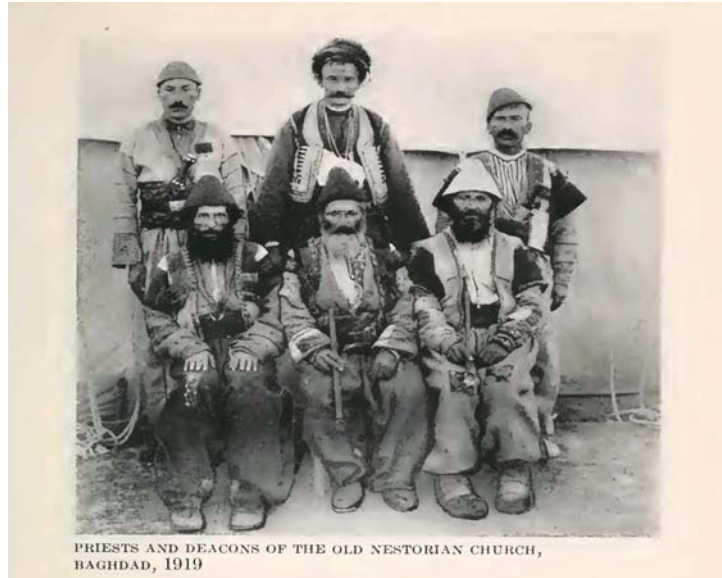
PRIESTS AND DEACONS OF THE OLD NESTORIAN CHURCH, BAGHDAD, 1919

Nasturi toplumunda, özellikle Hakkâri Bölgesi'ndeki erkekler, saçlarının büyük bir bölümünü keserlerdi. Sadece arka kısımdaki saçları uzun kalırdı. Bu uzun saçlar örülerek başın arkasından sırta doğru domuz kuyruğu biçiminde sarkardı. Başlarına da koni biçiminde bir başlık giyerlerdi 10 .