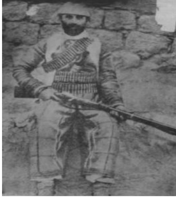
1890 yılında Tiyari kabilesine ait bir silahlı 19

Urmiye Bölgesi'ndeki Nasturi erkekler ise kıyafetlerinde daha çok mavi ve siyah tonlu kumaşları tercih etmekteydiler. Yaşlı Nasturiler, daha çok kısa pantolon ve mavi rengi kullanmaktaydılar 17 . Delikanlılarsa, özellikle sarı zikzak nakışlı, geniş, kırmızı pantolonlar giymekteydiler 18 .