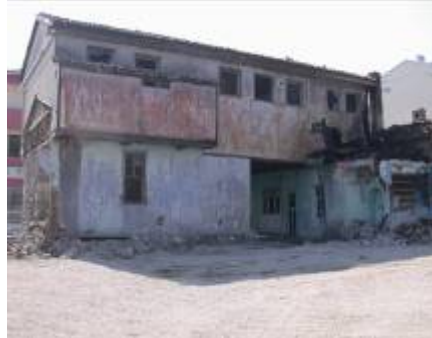
Levha-10 Kepeci Mahallesi, Hüseyin Avni Paşa Caddesi 5 nodaki evin avluya açılan bölümünün görünümü.