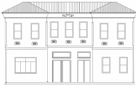
Levha-21 Kepeci Mahallesi, Hüseyin Avni Paşa Caddesi, 5 nodaki evin giriş cephesi çizimi Soldaki daha büyük olan kapı avluya açılmaktadır. (Çizim: Doğan Demirci)