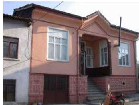
Levha-6 Dođancı Mahallesi, Efendi Sokak, 5 nodaki evin giriř cephesinin sokaktan grnm.