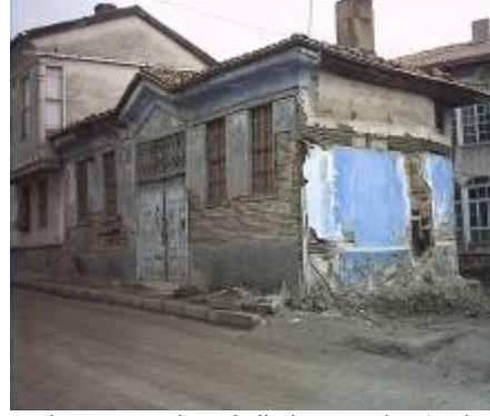
Levha-2 Kepeci Mahallesi, Hseyin Avni Pařa Caddesi, 9 nodaki gney ynde ki evin giriř cephesinin grnm.