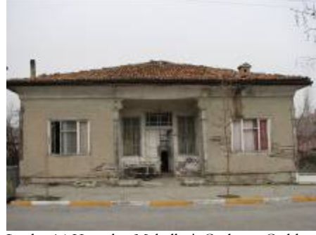
Levha-14 Kurtuluş Mahallesi, Çayboyu Cadde, 104 nodaki evin giriş cephesinin görünümü