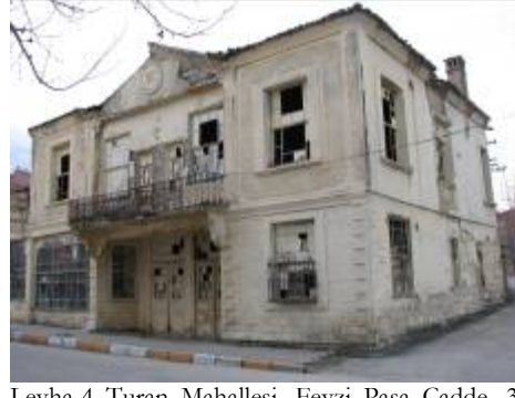
Levha-4 Turan Mahallesi, Fevzi Pařa Cadde, 36 nodaki evin kuzeydođu ynde ki giriř cephesinden grnm.