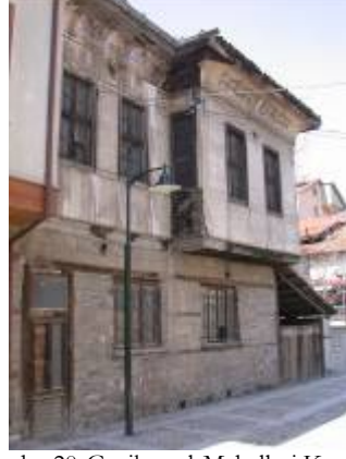
Levha-20 Gazikemal Mahallesi, Kemeraltı Sokak, 6 nodaki evin giriş cephesinin görünümü