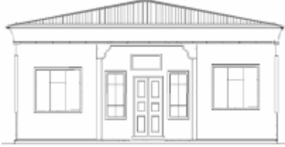
Levha-13 Kurtuluş Mahallesi, Çayboyu Cadde, 104 nodaki Evin giriş cephesinin çizimi Evin girişi içeriye alınmış durumdadır. (Çizim: Doğan Demirci)