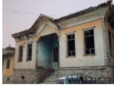
Levha-16 Çelebiler Mahallesi, Damgacı Sokak, 4 nodaki evin giriş cephesinin görünümü