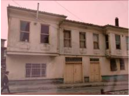
Levha-9 Kepeci Mahallesi, Hüseyin Avni Paşa Caddesi, 5 nodaki evin güney yöndeki giriş cephesinin görünümü.