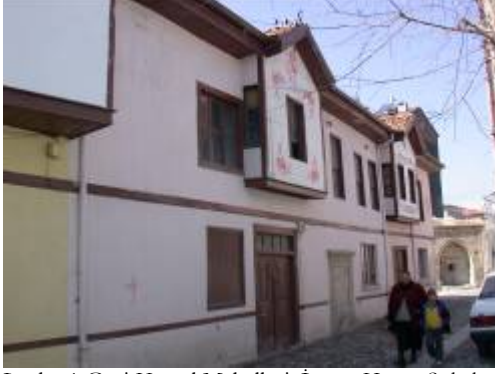
Levha-1 Gazi Kemal Mahallesi, İmam Hasan Sokak, 9 nodaki evin dođu ynde ki giriř cephesinin grnm.