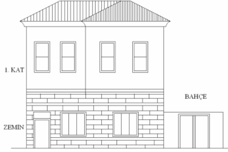
Levha-19 Gazikemal Mahallesi, Kemeraltı Sokak, 6 nodaki evin giriş cephesinin çizimi. Düz girişli ev örneğidir. (Çizim: B.uğra Kayalı)