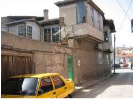
Levha-7 İskender Mahallesi, İmam Hasan Sokak, 2 nodaki evin doğu yöndeki giriş cephesinden görünümü.