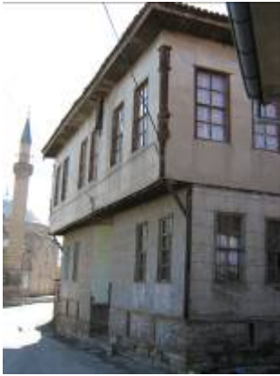
Levha-5 Dođancı Mahallesi, Yokuřbařı Sokak, 24 nodaki evin sokaktan grnm.