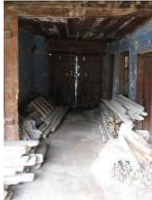
Levha-12 Kepeci Mahallesi, 117 Cadde, 35 nodaki evin girişinin içeriden görünümü