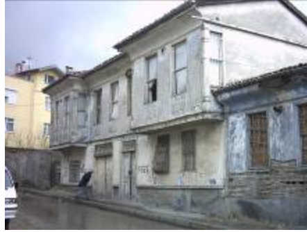
Levha-22 Kepeci Mahallesi, Hüseyin Avni Paşa Caddesi, 5 nodaki evin giriş cephesinin görünümü.