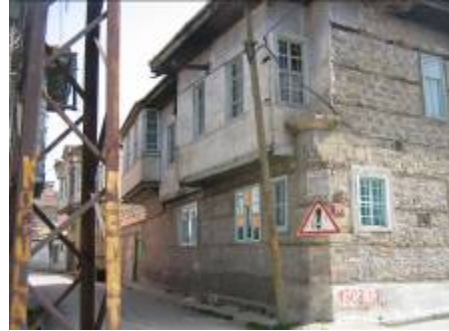
Levha-18 İmam Hasan Sokak, 2 nodaki evin Doğu cephesinin görünümü. Avluya giriş bu yönden sağlanmaktadır.