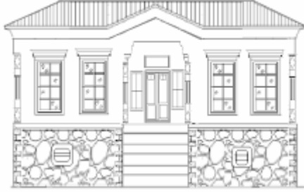
Levha-15 Çelebiler Mahallesi, Damgacı Sokak, 4 nodaki evin giriş cephesinin çizimi. Evin girişi yükseltilerek cephe aksının ortasından verilmiştir. (Çizim: Doğan Demirci)