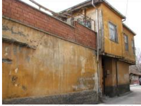
Levha-8 Turan Mahallesi, 2307 -2217 Sokakta bulunan evin doğu yöndeki giriş cephesinin sokaktan görünümü