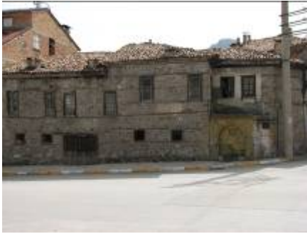
Levha-11 Kepeci Mahallesi, 117 Cadde, 35 nodaki evin dört sokağın keşiştiği meydandan giriş cephesinin görünümü