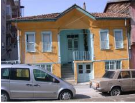
Levha-3 elebiler Mahallesi, Damgacı Sokak, 24 nodaki evin gney ynde ki giriř cephesinin grnm.