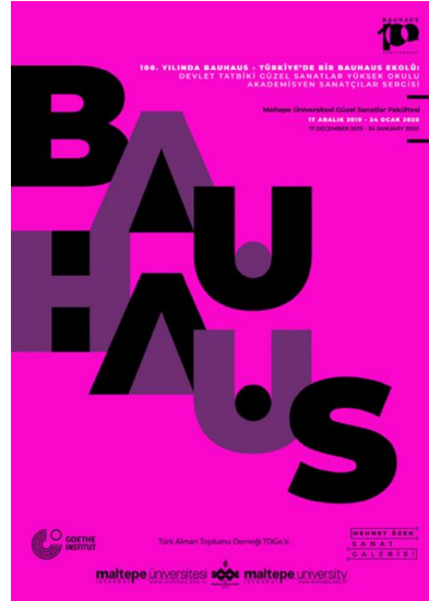
Resim 6. Türkiye'de bir bauhaus ekolü: Devlet Tatbiki Güzel Sanatlar Yüksek Okulu'ndan Sanatçılar Sergisi, 2020, Maltepe Üniversitesi, İstanbul (URL 5).

Bauhaus'un Türk Grafik Tasarımına olan etkilerine örnek olarak uluslararası araştırma projesi olan bauhaus imaginista gösterilebilir. Proje, Bauhaus Okulu'nu kuruluşunun 100. yılında yeniden yorumlamaktadır. Bauhaus'u uluslararası bir boyutta değerlendirip, dünyanın farklı yerlerindeki tasarımcıların Bauhaus tasarım anlayışı üzerinde iş birliği yapmalarına olanak sağlamaktadır. Bu proje 4 temel kavramı işlemektedir. Bu kavramlardan biri olan Moving Away (Uzaklarda) Marcel Breuer'in 1926 yılında yaptığı