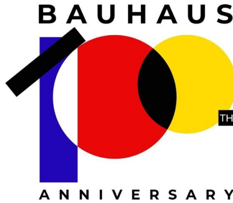
Resim 5. Bauhaus'un 100.yılı logosu, 2020, Maltepe Üniversitesi, İstanbul (Maltepe Üniversitesi, 2019:03).

Bauhaus'un 100. Yıl logosu ile serginin davetiye ve afiş tasarımı Maltepe Üniversitesi Grafik Tasarım Bölümü Başkanı Doktor Öğretim Üyesi Seyit Mehmet Buçukoğlu tarafından Bauhaus Okulu'nun tipografi yaklaşımı göz önüne alınarak tasarlanmıştır.