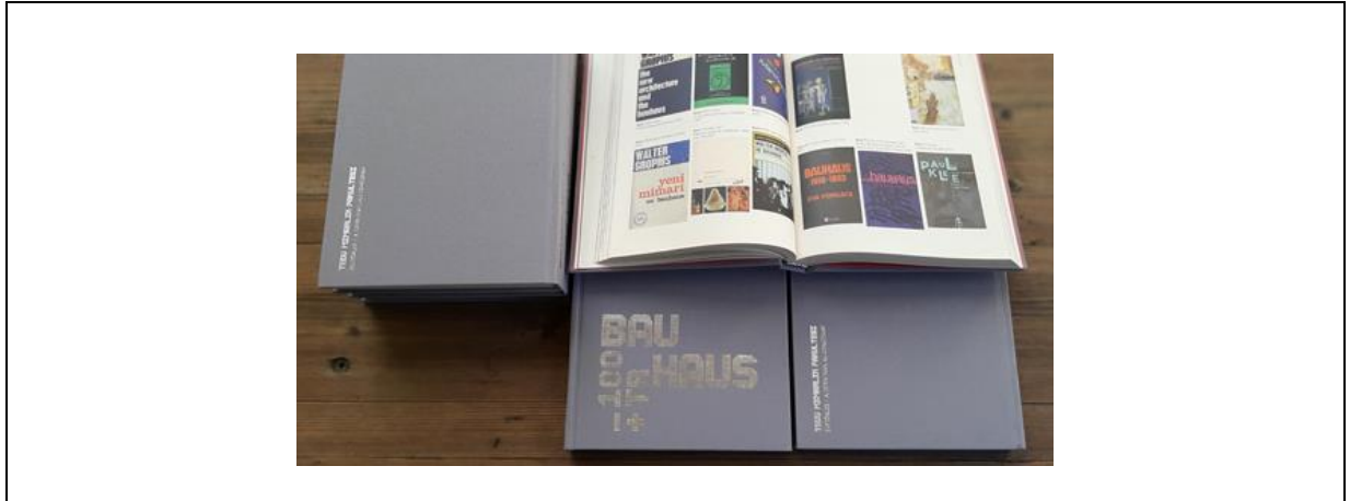
Resim 8. Bauhaus_100+TR, 2020, Ankara, (URL 7).

Bir diğer örnek; Ted Üniversitesi Mimarlık Fakültesi Yayınları tarafından 2019 yılında yayımlanan, fakültenin öğretim kadrosundan 18 yazarın 16 makale-denemesinden oluşan BAUHAUS_100+TR gösterilebilir. 100. yılını kutlayan Bauhaus tasarım anlayışı hakkındaki görüşler toplu olarak bu kitapta paylaşılmıştır.