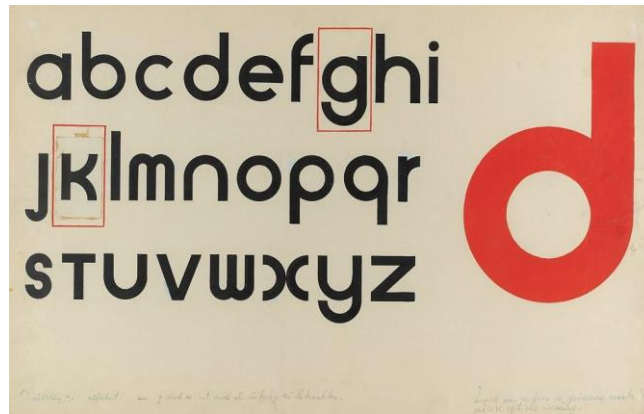
Resim 2. Herbert Bayer, Universal Yazı Tipi Geliştirme Araştırmaları, 1925, Harvard Sanat Müzeleri, Cambridge, (URL 2).

“Bayer, 1923'te Bauhaus'daki çalışmalarını bitirirken tek harfli, sans serif alfabesi tasarlamaya başladı. Alfabeyi okulda basım ve reklam atölyesinin ustası olarak atandığı 1925 yılında tamamladı, ancak alfabeyi birkaç yıl daha gözden geçirmeye devam etti. Universal, mükemmel daireler ve düz, yatay ve dikey çizgi formlarıyla Bauhaus'un değerlerini yansıtmak için tasarlandı, netlik, mekanik hassasiyet, ekonomi ve verimliliği aktardı. Bu değerler okul için o kadar önemliydi ki, okulun kurumsal kimliği de bu değerler etrafında şekillendi” (Lim, 2018: 6-7).