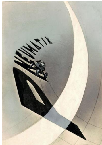
Resim 1. Laszlo Moholy-Nagy, “Pneumatik” afiş, 1923, New York/VG Bild-Kunst, Bonn (URL 1).

Nagy, aynı zamanda tipografi ve fotoğrafı birleştirerek “Typofoto” olarak adlandırdığı tasarım yöntemiyle tipografiye yenilikçi bir yaklaşım kazandırmıştır. Moholy-Nagy, tipografi ve fotoğrafın birleşiminden doğan bu fotomontaj tekniğinin geliştirilmesinin grafik tasarım alanına sunacağı yeni olasılıkların, sonraki yıllar için büyük bir adım olacağını ve tasarım sürecini tamamen değiştireceğini öngörmüştür. Bu tekniğe en iyi örneklerden biri “Pneumatik” adını verdiği çalışmasıdır.