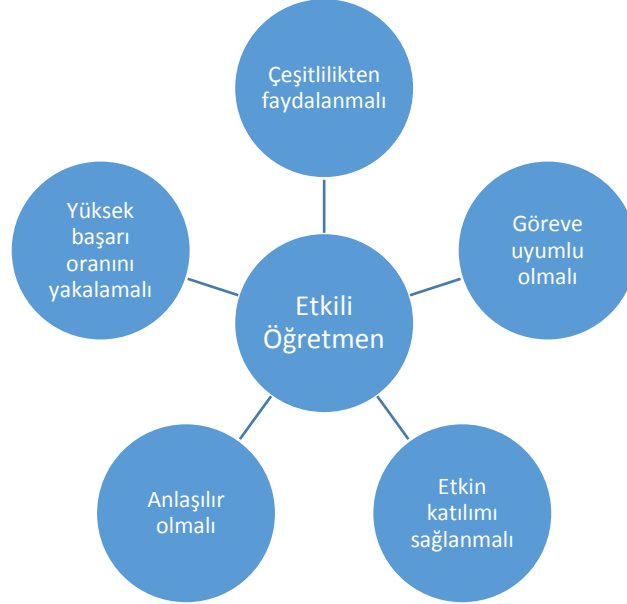
Şekil 1. Etkili öğretmen nitelikleri (Borich, 2014)

öğretim strateji ve araç gereçlerini seçme” gibi durumlarını göz önünde bulundurması gerektiğini ifade etmektedir. Borich’e (2014) göre etkili öğretmen niteliklerinin anahatları aşağıdaki Şekil 1’de gösterilmiştir: