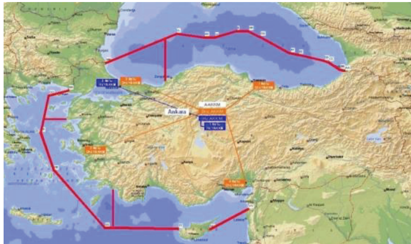
Şekil 1. Türk Deniz Arama ve Kurtarma Sahaları (Türk Arama ve Kurtarma Yönetmeliği.)

Deniz-AAKKM'nin A/K faaliyetlerinin yürütülmesinden sorumlu olduğu deniz sınırları şekil-1'de belirtilmiştir. Deniz-AAKKM, A/K görevini, kendisine bağlı 4 ad. Yardımcı Arama Kurtarma ve Koordinasyon Merkezi (YAKKM) vasıtasıyla yerine getirmektedir. YAKKM'lere bağlı Arama ve Kurtarma Merkezleri (AKAMER) bulunmaktadır, A/K operasyonlarını gerçekleştiren vasıtalar AKAMER'lere bağlıdır.