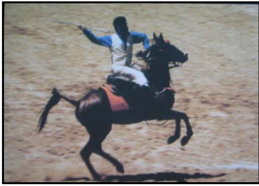
Şekil 2 Cirit Atma

Cirit Oyunu'nda iki takım bulunur. Bu takımlar karşılıklı olarak alanın en gerisinde aralarında 100 m bırakarak karşılıklı dizilirler. Ciritçiler bölgesel giyimleriyle atlarına binerler. Sağ ellerine atacakları ilk ciriti, diğer ellerine de yedek ve kamçı alırlar ( http://www.erzincan.gov.tr/cirit.htm , 2006).