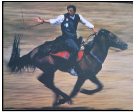
Şekil 3 Cirit Yakalama