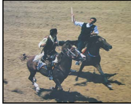
Şekil 5 Rakibi yakalayıp bağışlama (IRMAK ve Ark., 1999)

Ciritin ata isabet etmesi halinde ciriti atan oyuncu oyun dışı kalır bu yüzden atlılar kendilerine atılan ciritten kurtulmak için at üzerinde çeşitli taktikler (eğer boşaltma) uygularlar. Bütün oyuncuların ellerindeki ciriti atmalarından sonra en fazla puan alan galip takım ilan edilir. Günümüzde cirit modernize olmuş ve artık resmi bir spor dalı haline gelmiştir (YALMAN, 1977).