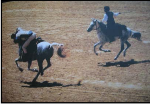
Şekil 4 Eger Boşaltma (IRMAK ve Ark., 1999)