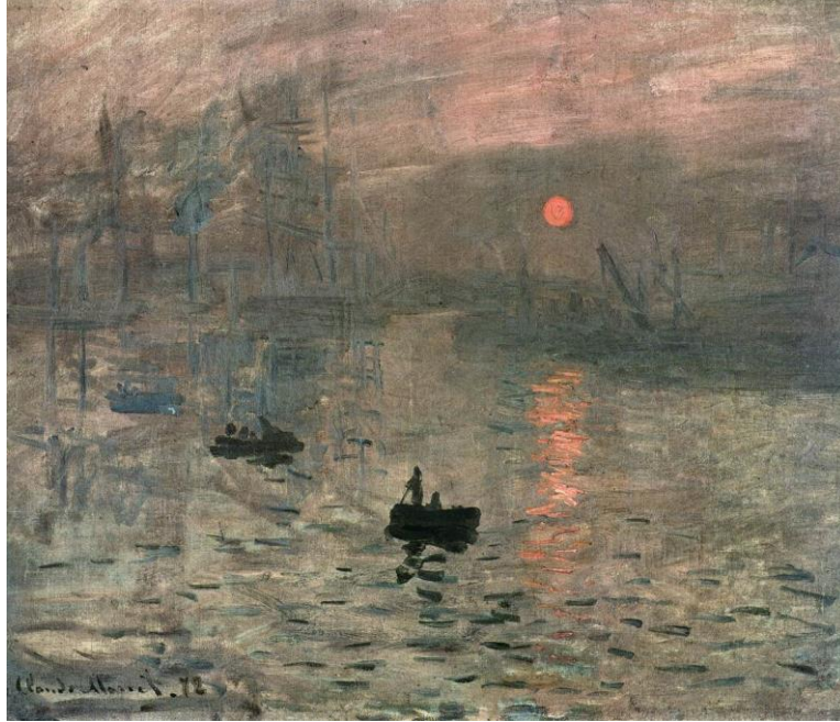
Resim-1: Claude Monet, “İzlenim” / Impression, Sunrise. (1873). Tuval üzerine yağlıboya, 48 x 63 cm. Musée Marmottan Monet, Paris.

“Empresyonistler” (İzlenimciler) adı, Claude Monet 'nin “Impression: soleil levant” adındaki resminden esinlenerek verilmiş bir ad (Newall, 2008, 9) olduğunu tekrar hatırlatarak derse devam edebiliriz.