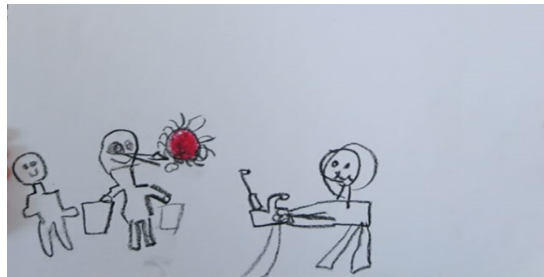
Şekil 4. Ç2'nin çizimi