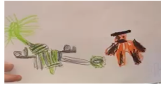
Şekil 6. Ç11'in çizimi