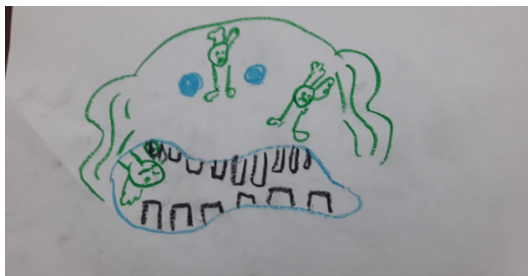
Şekil 7. Ç7'nin çizimi