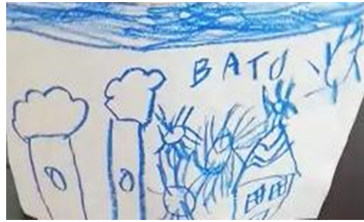
Şekil 2. Ç5'in çizimi