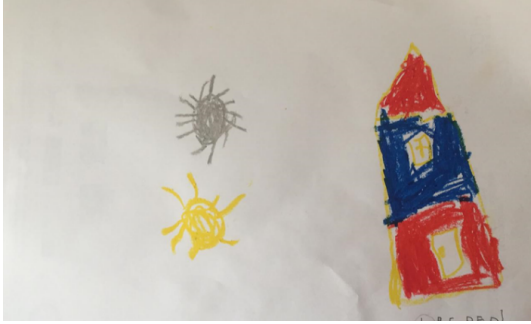
Şekil 1. Ç1'in çizimi