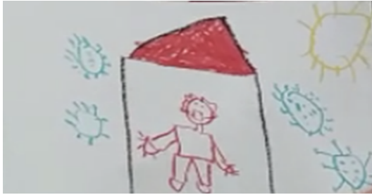
Şekil 3. Ç9'un çizimi