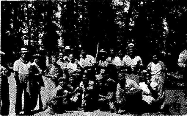
Resim: 2 amlıca Tepesi'nde