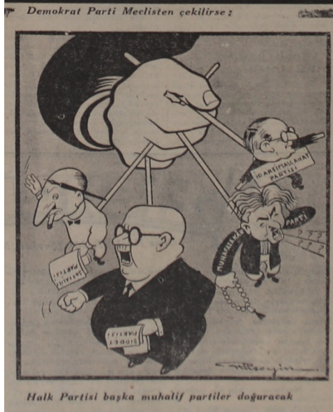
Resim 1: Demirkırat , 26 Mayıs 1947, s. 1.

Demirkırat , zaman zaman bazı nüshalarını önemli isimlerin hatıratlarına ayırmıştı. Örneğin, Ahmed Ağaoğlu’nun hatıralarına “ Milli Mücadele’de Ankara’nın İlk Günleri ” başlığı altında yer verilmişti. Hatıratın ilk bölümü gazetenin 12. sayısında 3 Temmuz 1947 tarihinde başlamış 34 ; on bir bölüm halinde yayınlanan hatırat 22. sayısında 7 Ağustos 1947 tarihinde son bulmuştu 35 . Ahmed Ağaoğlu’nun, “Malta Hatıraları” da gazetede neşredilmişti. 26 Ağustos 1947 tarihli 30. Sayıda başlayan anılar, tefrika halinde her gün yayınlanmış, fakat 10 Eylül 1957’de yayınlanan 45. ve son sayıdaki 16. tefrikada kalmıştı.