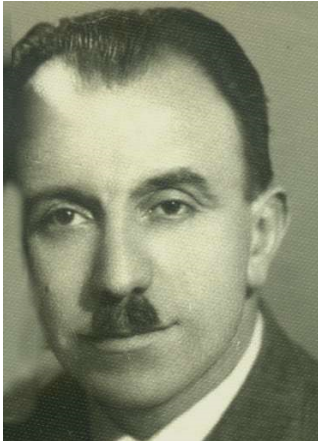
Mahmut Fikret Karakoyunlu

Mahmut Fikret Karakoyunlu, 1906'da (1322) Urfa Siverek'te 2 dünyaya gelmiş bürokrat, avukat, siyasetçi, gazeteci ve aynı zamanda bir entelektüeldir. Karakoyunlu, bunca farklı kimliği şahsında barındırmış olmasına karşın, yakın dönem siyasi ve kültür hayatımızda adı çok fazla bilinen bir isim olmamıştır. O'nun Demokrat Parti'nin kuruluş sürecinde yer alması, o günlerde Demirkırat gazetesini yayımlaması ile birlikte ismi kamuoyunda duyulur olmaya, dikkat çekmeye başlamıştır.