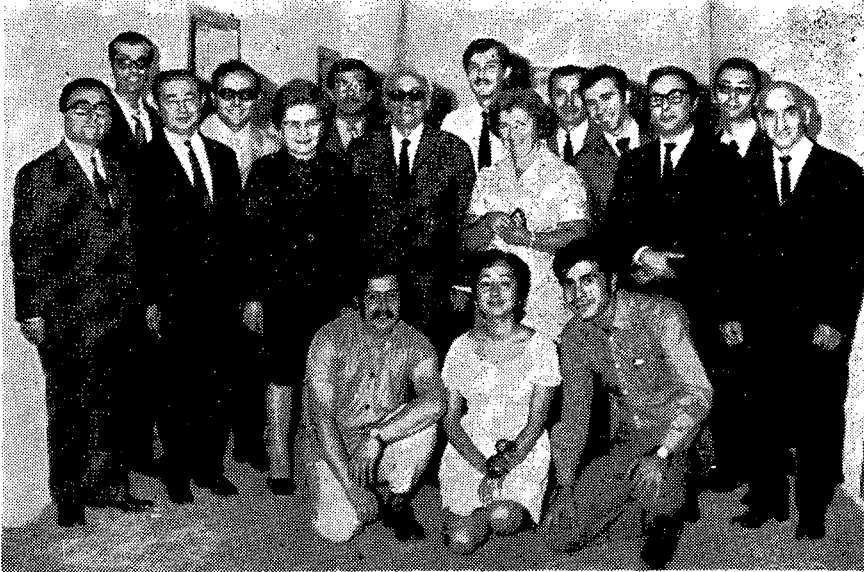
Enstitü Üyeleri ve Öğrenciler