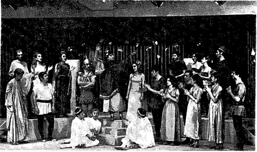
Gyula Hay'in "At" oyunundan bir sahne