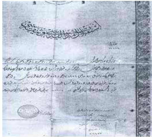
İSTİKLAL MADALYASI VESİKASI