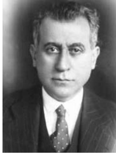
Türkiye Cumhuriyeti Temsilcisi, Dışişleri Bakanı Hasan Saka Birleşmiş Milletler Antlaşmasını İmzalarken, San Francisco, ABD, 26 Haziran 1945, Türkiye Cumhuriyeti Dışişleri Bakanı Hasan Saka

Moğolistan Cumhuriyeti, BM'ye üyelik için 1946 yılından başlayarak 1961 yılına kadar 15 yıllık süre zarfında 4 defa başvuruda bulunmuş ve toplam 13 kere değerlendirmeye alınmıştır. İkinci başvuruyu Kh. Choibalsan'ın imzası ile 25 Ekim 1948'te yapmış, 16 Haziran 1949; 19 Aralık 1951; 1 Şubat 1952; 5 Eylül 1952; Kasım 1954; 1955 yılı sonbaharında olmak üzere sırasıyla görüşmeler yapılmıştır (Tserentsoodol, 1958: 70).