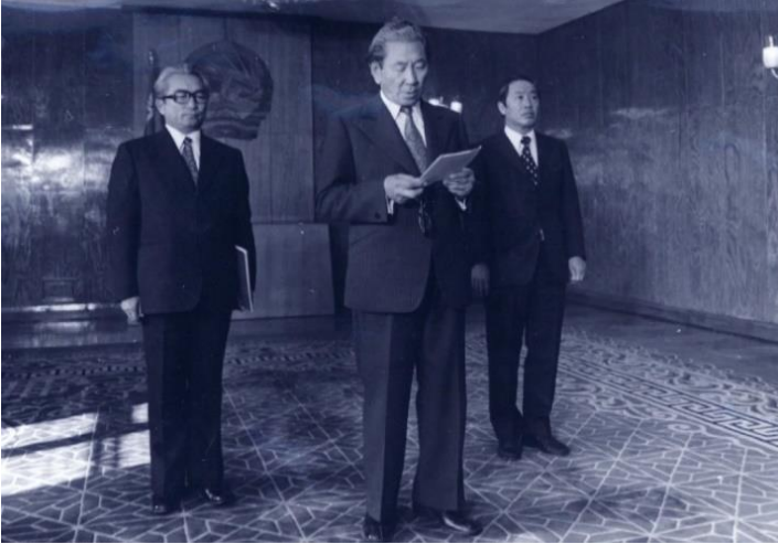
Türkiye Cumhuriyeti Büyükelçisi Namık Yolga Moğolistan Halk Cumhuriyeti Halkın Yüksek Kurultayı Başkanları 1. Birinci Başkan Yardımcısı S.Luvsan'a güven mektubunu sunarken. 1971 yılı.

Soğuk Savaş dönemi Moğolistan-Türkiye ilişkilerinin diplomatik kurallara uygun olarak ulusal bayramlarda karşılıklı telefon mesajları göndermek, afet durumunda başsağlığı dilemek, ulusal bayram etkinliklerine katılmak, belirli kültür ve sanat etkinlikleri ile sınırlı olduğunu belirtmek gerekir.