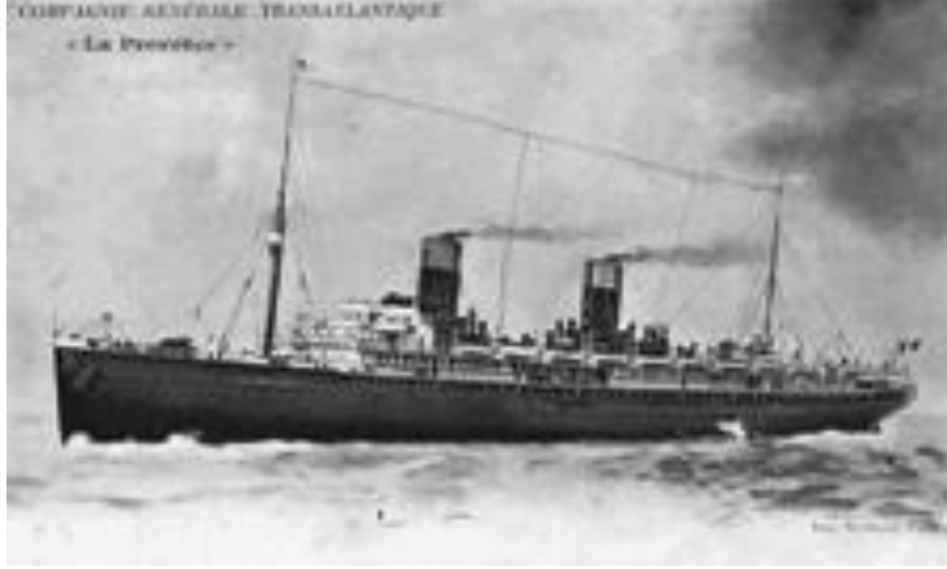
Resim 5: ABD'ye göç eden Göçmen yolcuların kullandıkları gemi.

göz renginin kahverengi ve siyah kalın saçları olduğu bilgileri de kaydedilmiştir. Yakın dönem kayıtlarında eski dönemdeki kayıtlardan farklı olarak gemi bilgilerine yer verilmediği de görülmektedir.