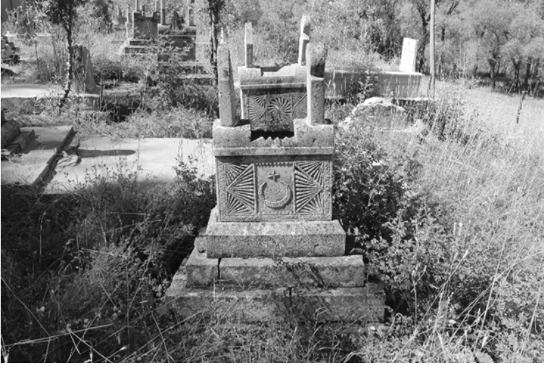
Şekil 6: Kimliği Belirsiz Mezar Taşı

Alevi - Bektaşî gelenekleri hakkında pek çok araştırmada bulunmuş olan Irène Mélikoff, “Atalarının yaşam tarzına hâlâ bağlı öbür Orta-Asya Türk topluluklarında olduğu gibi, göçebe aşiret cemiyetlerinde görülen bir inançlar mozağinin bir din senkretizminin, Bektaşî - Aleviliğın temel bir