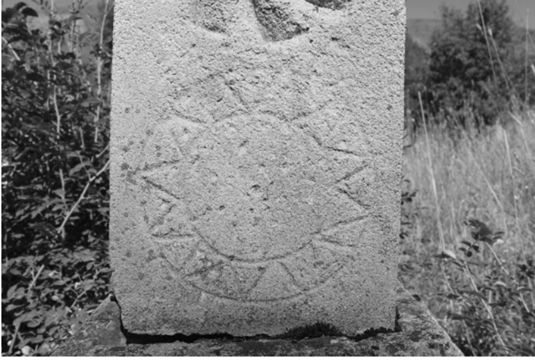
Şekil 5: Kimliği Belirsiz Mezar Taşı Üzerindeki Güneş Motifi