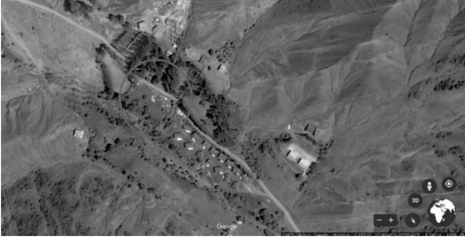
Şekil 1: İşaretli alan, Bolucan Köyü Mezarlığı

Bolucan Köyü, Sivas'ın Zara ilçesinin 32 kilometre güney doğusunda bulunmaktadır. Haritada 39^{\circ} 40' 13.8900'' Kuzey ve 37^{\circ} 59' 35.0628'' Doğu koordinatlarında bulunan Bolucan Köyü, Sivas şehir merkezine 84 kilometre uzaklıktadır. Yine aynı bölgede bulunan Bolucan Nahiyesiyle sıklıkla karıştırılmaktadır. Köy, nahiyeden çok daha eski bir yerleşim yeridir.