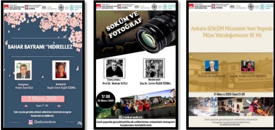
Görsel 2. Ankara Somut Olmayan Kültürel Miras Müzesi Instagram Konferans Afiş örnekleri