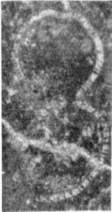
Fig. 1 — Embergerella anatolian n. g., n. sp. Coupe transversale montrant les deux éléments (x26). P.M. TG-401; Holotype.

paroi est mince, peu calcifiée, d'épaisseur constante, traversée par des branches primaires de forme ellipsoïdale, assez régulières. Les branches sont disposées alternativement. Ceci est bien visible dans les sections tangentielles.