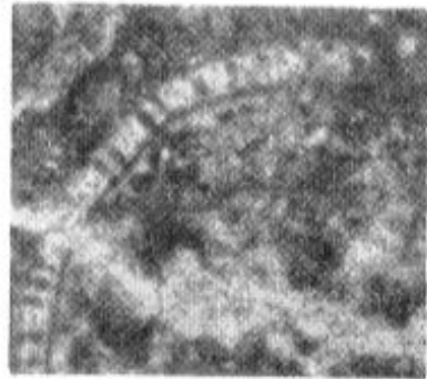
Fig. 3 — Embergerella anatolian n. g., n. sp. Coupe de la paroi calcaire (x34). P.M. TG-401.

Les sporanges se trouvent dans la cavité centrale pres de la paroi; ils sont peu calcifiés.