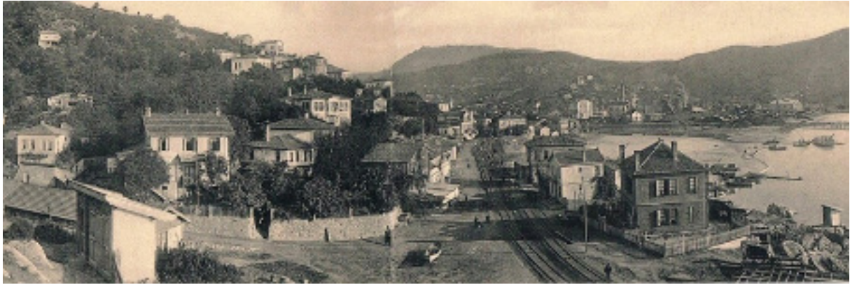
Şekil 3. 20. Yüzyılın başlarında Zonguldak'tan görüntüler (sol üst fotoğraf sonradan renklendirilmiş olmalıdır)