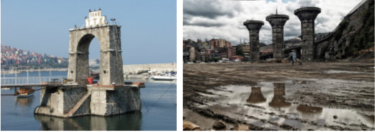
Şekil 8. Şehirde eskilerden hatıra bırakılan yükleme iskelesi (Şarjöman rapid) ve lavvar tesisinin kalıntıları