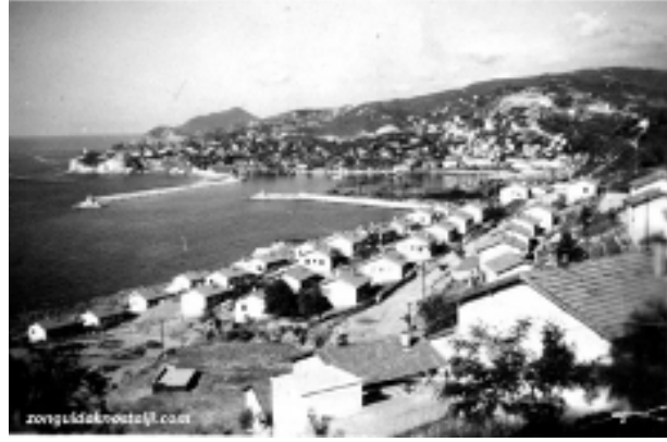
Şekil 4. Zonguldak'ta işçi lojmanlarından eski görüntüler

Lojman ve diğer tesislerin çoğu sadece Zonguldak kent merkezi yakınında değil, 1960'lı yılların başlarında kömür ocaklarının bulunduğu diğer yerleşimlerde de yapılmış, böylece her işletme bölgesinde yeni kentler (Kozlu, Kandilli, Kilimli, Karadon, Gelik) oluşmuştur. Ayrıca, termik santralin yapımıyla Kilimli'nin doğusunda Çatalağzı kenti doğmuştur. Kandilli hariç, diğer küçük kentler bir banliyö gibi Zonguldak ile karayolu veya hem karayolu hem de demiryolu ile bağlıdır. Zonguldak ve yakın çevresinde kentleşmeyi geliştiren ve genişleten en önemli ve son hamle 1940'lardan itibaren işçi alımlarının çoğalması ve il dışından işçi alımıyla kente ve yakın çevresine yoğun işçi göçüdür. Bu işçi göçü 1970'li yılların sonuna kadar artarak devam etmiş, artan nüfus kentleri kırsala doğru genişletmiştir. Çoğunlukla da gecekondulaşmaya neden olmuştur.