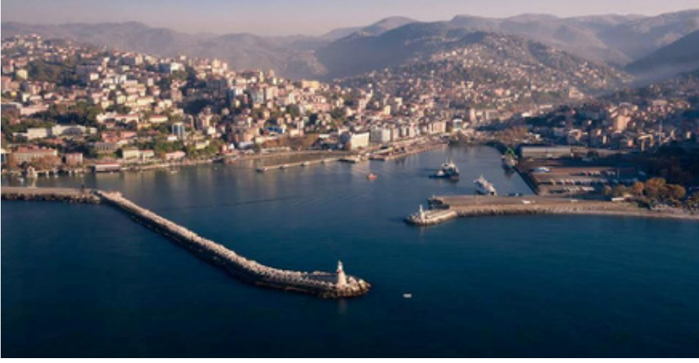
Şekil 6. Karadeniz üzerinden Zonguldak limanı ve şehrin görüntüsü

bölümü, 1910 tarihli 289 sayılı Tezkere-i Samiye'yle hazine mülkiyetine geçirilmiştir. 1940' yılında bütün ocaklar 3867 sayılı kanun hükümlerine göre Ereğli Kömürleri İşletmesi adına satın alınmış ya da istimlak edilmiştir. Kentsel yerleşim alanlarının kanunlarla kısıtlanmış olması, hazine ve belediye arazileri üzerinde gecekonduların yapımını kaçınılmaz kılmıştır.