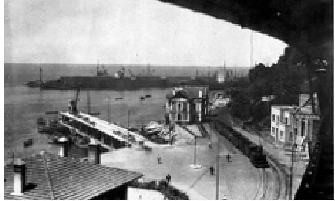
Şekil 2. Zonguldak limanından 20. Yüzyılın başlarından (solda) ve ortalarından (sağda) görüntü

3 Mart 1877 Tarihinde Mehmet Paşa tarafından hazırlanan ve Zonguldak Kenti'nin doğuşunu belirleyen Havza'yı ıslah layihasında (planında) şunlar yazılıydı: