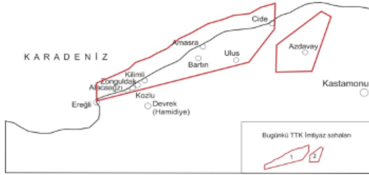
Şekil 1. 1869 Kastamonu Salnamesi'nde Zonguldak ve yakın çevresinde adı geçen yerleşimler ve bugünkü bilgilere göre Zonguldak Taşkömürü Havzasının konumu (havza sınırları www.unece.org, Ali Baltaş'tan alınmıştır)