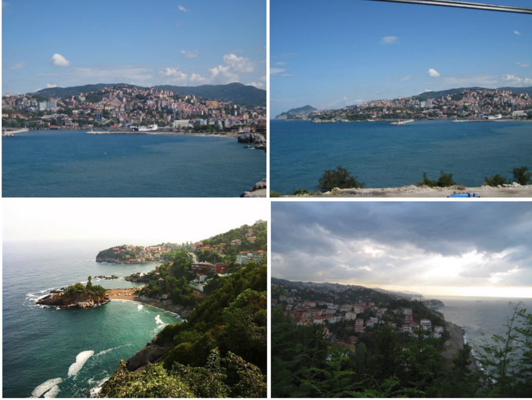
Şekil 5. Zonguldak'tan güncel görüntüler

Kömür ocaklarının devletleştirildiği 1940 yılında Zonguldak kent nüfusu 27972 iken, 1950'de 35631'e ulaşmıştır. Ülkemizde kentlere göçün hızla artmasıyla birlikte, Zonguldak nüfusu 1955'de 48000'e, 1960'da 54010, 1965'de ise 60865'e yükselmiştir (Zonguldak 1967 İl Yıllığı).