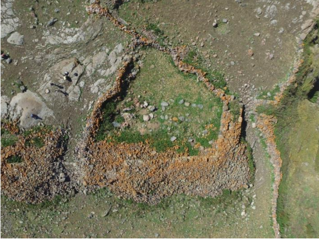
Resim 6. Bayramoğlu Kalesi'nden bir detay fotoğraf.