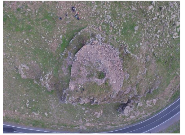
Resim 16. Balçesme-Kaynık Kalesi'nin havadan görünümü.