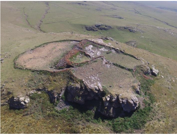
Resim 7. Bayramoğlu Kalesi'nin batıdan görünümü.