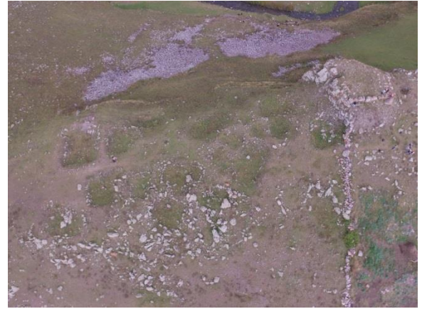
Resim 23. Balçesme-Tekmezar Kulesi ve Yerleşiminin havadan görünümü.