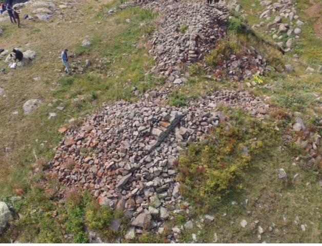
Resim 12. Bağdaşan Savunma Yapısı duvar kalıntılarının havadan görünümü.