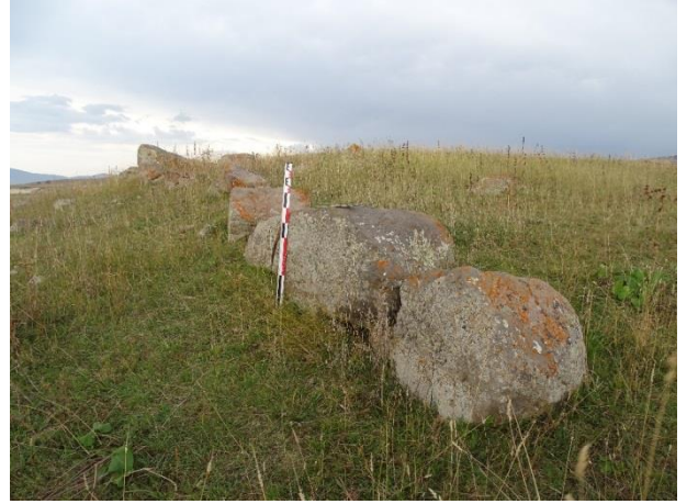
Resim 27. Durucasu-Şimşimik Kalesi'nden bir in situ duvar kalıntısı.