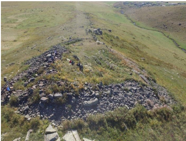
Resim 2. Çağlayık'ın doğusundaki arkeolojik alanın kuzeyden görünümü.