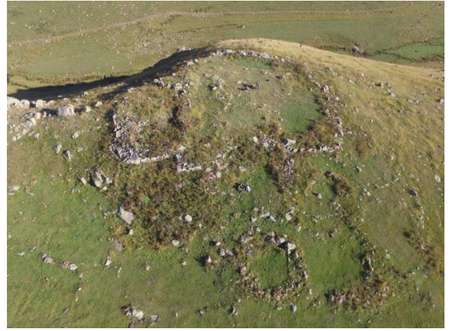
Resim 3. Çağlayık Kuzey Kalesi'nin havadan görünümü.