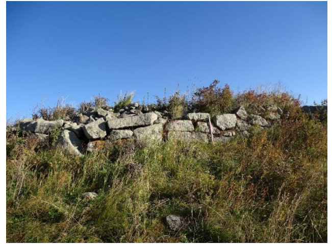
Resim 4. Çağlayık Kuzey Kalesi'nden bir in situ duvar.