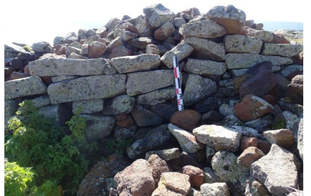
Resim 11. Bağdaşan savunma Yapısından bir in situ duvar detayı.