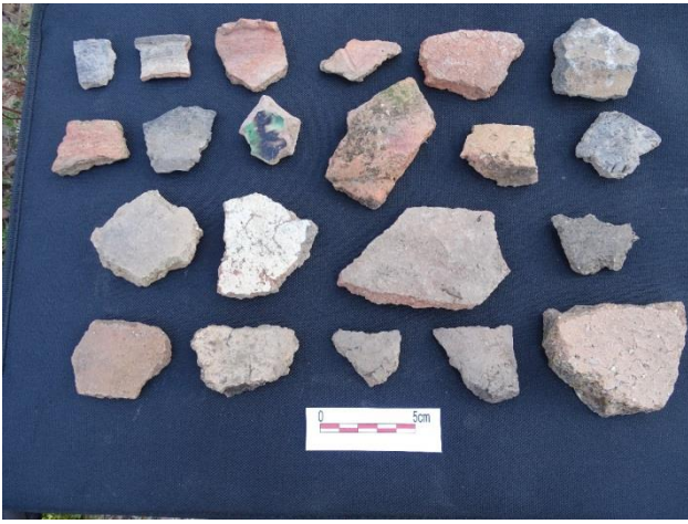
Resim 19. Balçesme-Kaynık Kulesi'nden bazı Ortaçağ seramikleri.