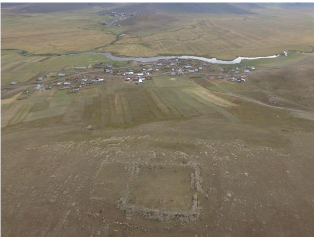
Resim 14. Bellitepe Kalesi ve kalenin güneyindeki geniş ova.