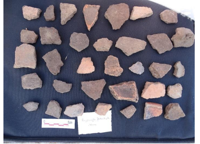
Resim 10. Bayramoğlu Kalesi'nden çanak-çömlek buluntuları.