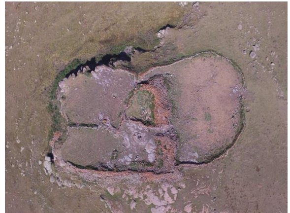
Resim 5. Bayramoğlu Kalesi'nin havadan görünümü.