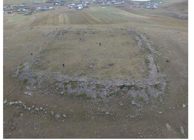
Resim 15. Bellitepe Kalesi'nin havadan görünümü.