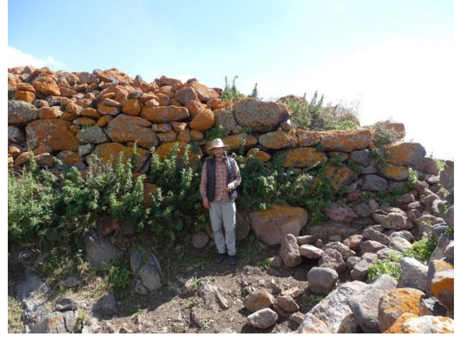
Resim 9. Bayramoğlu Kalesi'nin giriş bölümündeki in situ duvar kalıntısı.