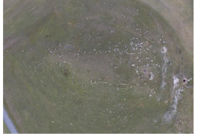
Resim 26. Bir höyük üzerinde yer alan Durucasu-Şimşimik Kalesi'nin havadan görünümü.