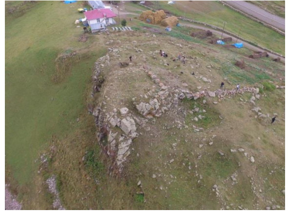
Resim 22. Balçesme-Tekmezar Kulesi'nin havadan görünümü.