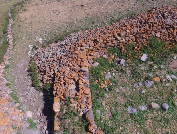
Resim 8. Bayramoğlu Kalesi'nin in situ duvarlarından bir görünüm.