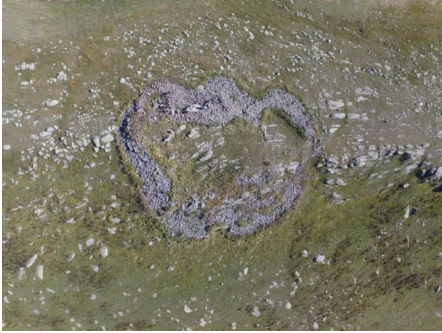
Resim 1. Çağlayık'ın doğusundaki arkeolojik alanın havadan görünümü.