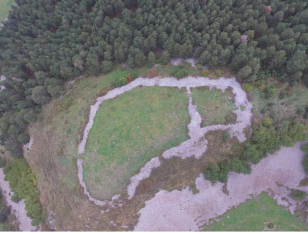
Resim 24. Balçesme-Çam Ormanı Eskiçağ Arkeolojik Alanı'nın havadan görünümü.