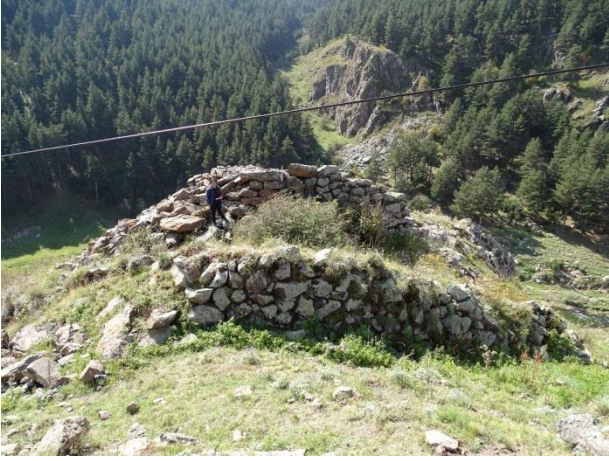
Resim 18. Balçesme-Kaynık Kulesi'nin kuzeyden görünümü.