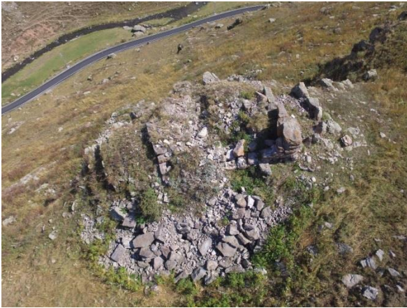
Resim 20. Balçesme-Şipsirik Kulesi'nin havadan görünümü.