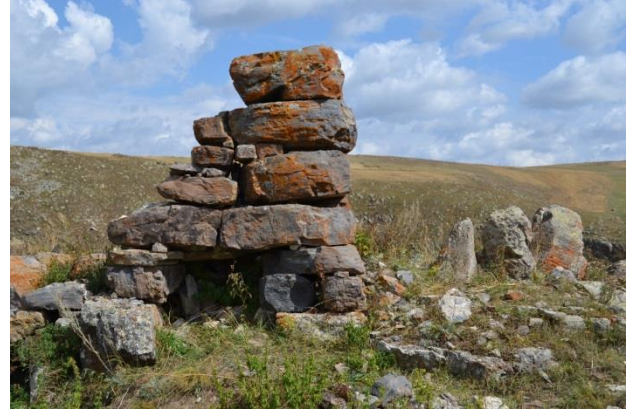
Resim 21. Balçesme-Şipsirik Kulesi'nin giriş bölümü.