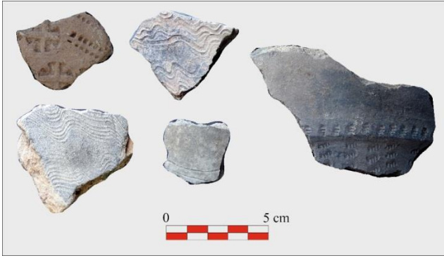
Resim 13. Bağdaşan Savunma Yapısı'ndan Ortaçağ seramikleri örnekleri.