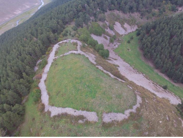
Resim 25. Balçesme-Çam Ormanı Eskiçağ Arkeolojik Alanı'nın havadan görünümü.