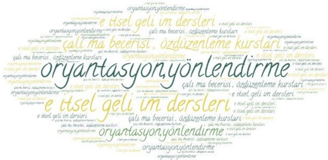
Şekil 1. Mega üniversitelerde sunulan eğitsel rehberlik hizmetleri

hizmetlerin de geliştirilmesi vurgulanmaktadır (Tresman, 2002; Simpson, 2002; Brindley, Walti ve Zavacki-Richter, 2004; Genç, 2018). Çevrimiçi öğrenmenin tüm süreçlerinde olduğu gibi danışmanlık hizmetlerinde de özel gereksinimli bireylere yönelik döküman, kaynak ve ihtiyaçlarına yönelik sağlanacak diğer danışmanlık hizmetlerinin önemli olduğu söylenebilir.