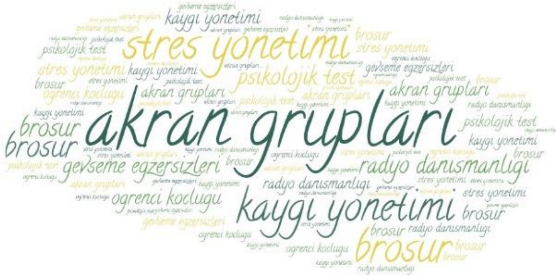
Şekil 1. Mega üniversitelerde sunulan kişisel-sosyal rehberlik hizmetleri

birbirinden farklı doğası ve faktörleri nedeniyle bireye özgü birebir danışmanlık hizmetinin verilmesi gerekliliği ve maliyeti ile açıklanabilir. Bu kapsamda ikili (dual) sistemde hizmet veren üniversitelerin, geleneksel öğrenenlere verilen hizmetlere uzaktan öğrenenleri dahil etmeleri maliyet açısından kolaylaştırıcı olacaktır (Floyd ve Casey-Powell, 2004). Ancak verilen destek hizmetlerinin uzaktan öğrenenlerin ihtiyaçları belirlenerek ayrı bir çerçevede verilmesi gerekmektedir (Tait, 2000; Rumble, 2000; Lapadula, 2003).