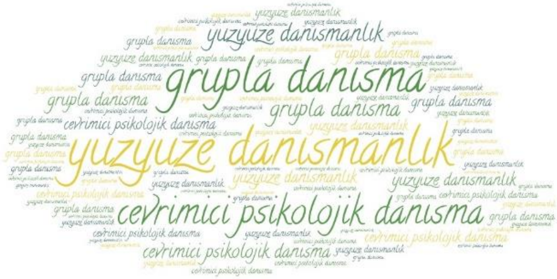
Şekil 3. Mega üniversitelerde sunulan psikolojik danışma hizmetleri