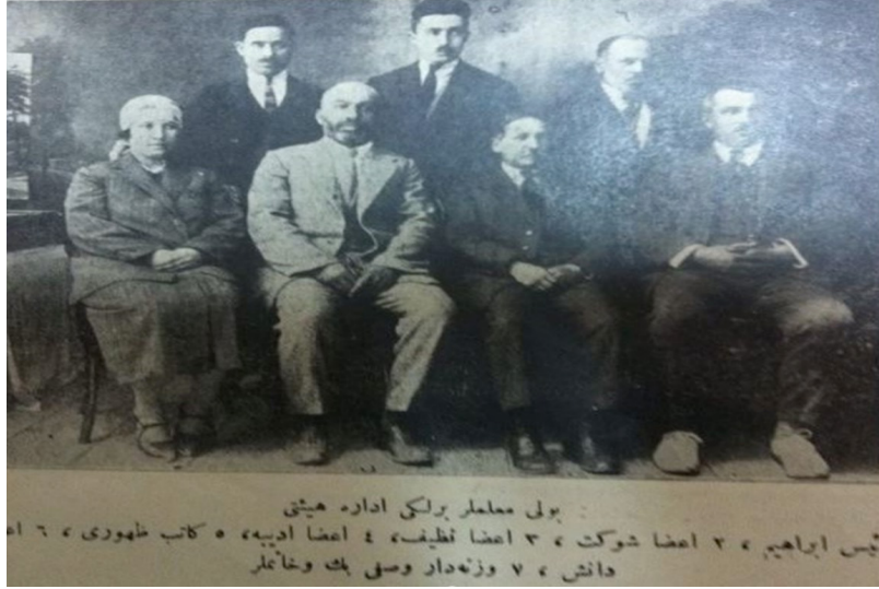
Bolu Muallimler Birliđi İdare Heyeti