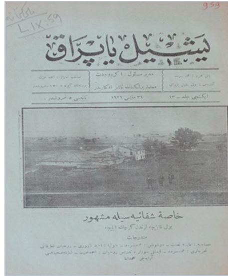
Yeřil Yaprak Dergisinin 2. sayısının kapak sayfası