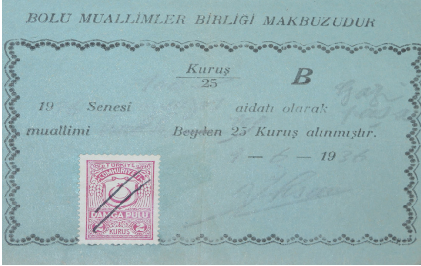
Bolu Muallimler Birliđi yardım makbuzu

çıkarttığı görülmemektedir. Ancak birlik faaliyetlerini kapatılıncaya kadar yürütmeye devam etmiştir. Üyeleri arasındaki birlik ve beraberlik duygusunu arttırmak için Taşoluk yaylasına piknik düzenlediğini bu gezinin de vilayet gazetesinde haber olarak yer aldığı görülmektedir. 56 Ayrıca Bolu muallimler Birliđi taşrada en aktif faaliyet yürüten şubelerden birisi olduğunu 1936 yılına ait bir yardım makbuzundan da görmek mümkündür. 57