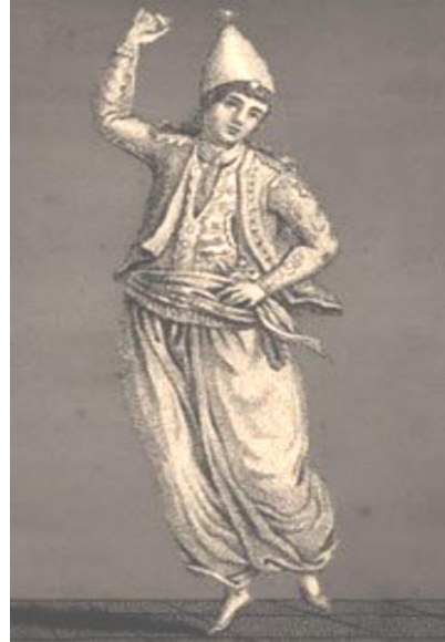
Şekil 2: Tavşanoğlanı (Erkan 2010, s. 18).