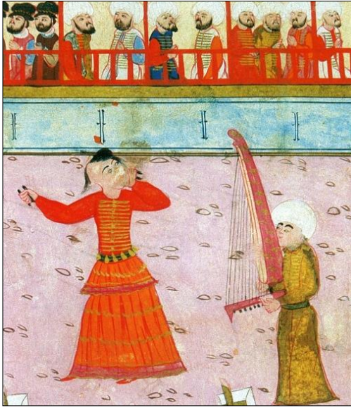
Şekil 1: Köçek (Ersoy 2007, s. 91).

giyerlerdi. 38 Tunik, pantolon, etek gibi giysiler ise, sırma ve gümüş işlemeli kadifelerden ve ince ipekten olurdu. 39 Siyah çuhadan ayak topuklarına kadar oldukça dar bir kıyafet giyen tavşanoğlanları ise, başlarını açmaz, küçük bir çeşit süslü başlık giyerlerdi. Köçekler etek, tavşanoğlanlar ise, şalvar giyerdi. 40 Reşad Ekrem Koçu'ya göre gösterilerini yapabilmeleri için "çok çetin" eğitimlerden geçen köçeklerin vücut yapıları düzgün ve yüz güzellikleri de ön planda olmalıydı. Yazar, köçek olmak isteyenlerin ayaklarının ve topuklarının iri, parmaklarının uzun ve ayak bileklerinin de gayet ince olması, ayakların bu özelliklerine uyum sağlayacak şekilde büyük ve uzun parmaklı ellerinin olması gerektiğini vurgulamıştır. Bu gereklilik, "...pervane gibi fırl fırl dönme, uçar gibi koşarken birden durabilmek, sıçramak, perende atmak, fiskeleme yürümek, sırt üzerine yay gibi kıvrılmak için..." çok önemliydi. 41 Verilen örneklerden anlaşılacağı üzere en azından Evliya Çelebi'den, yani 17. yüzyıldan başlayarak imparatorluğun sonlarına kadar köçek ve tavşanoğlanı gibi kadın kılığındaki rakkasların meyhânelerde boy göstermesinin süreklilik arz ettiği açıktır.