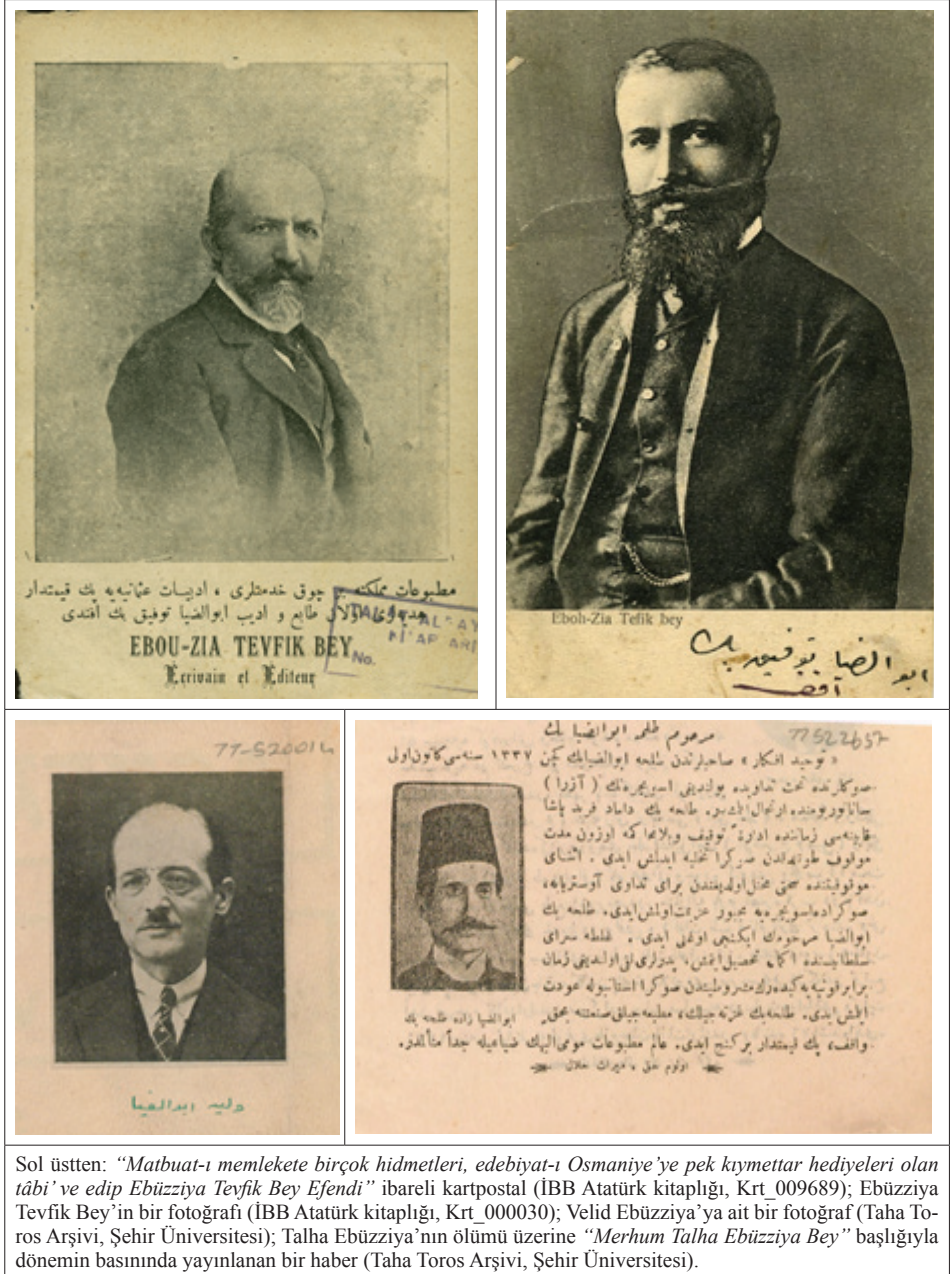
Sol üstten: “Matbuat-ı memlekete birçok hizmetleri, edebiyat-ı Osmaniye’ye pek kıymetli hediyeleri olan tâbi’ ve edip Ebüzziya Tefvik Bey Efendi” ibareli kartpostal (İBB Atatürk kitaplığı, Krt_009689); Ebüzziya Tefvik Bey’in bir fotoğrafı (İBB Atatürk kitaplığı, Krt_000030); Velid Ebüzziya’ya ait bir fotoğraf (Taha Toros Arşivi, Şehir Üniversitesi); Talha Ebüzziya’nın ölümü üzerine “Merhum Talha Ebüzziya Bey” başlığıyla dönemin basınında yayınlanan bir haber (Taha Toros Arşivi, Şehir Üniversitesi).