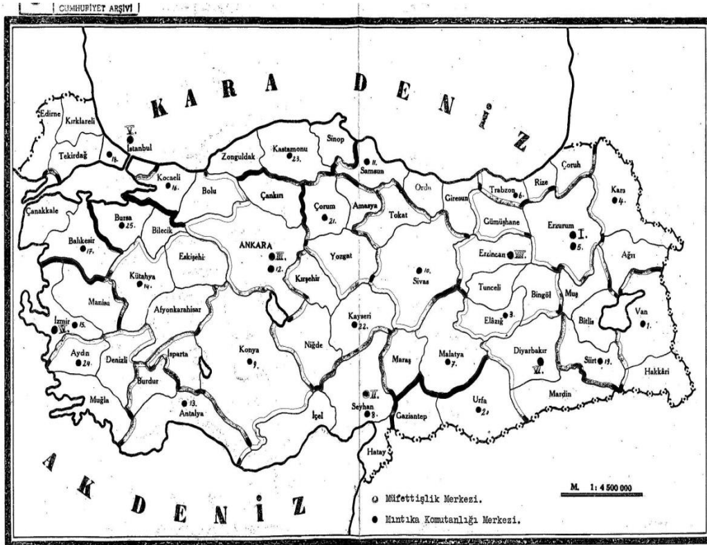
řekil 1. Jandarma Teřkilatının Bulunduęu Alanları Gösteren Harita