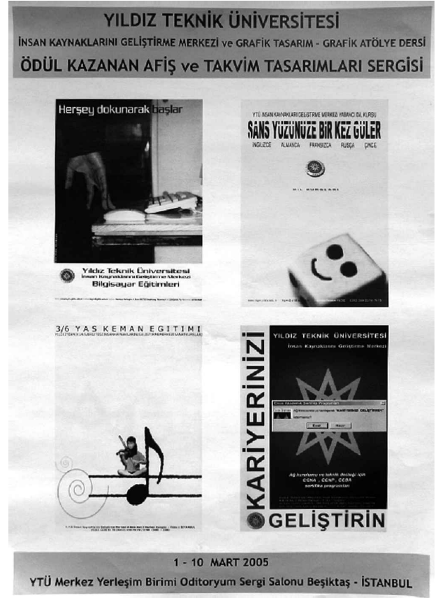
Resim 4. Afiş tasarımı: Mehmet Önder

Ezberleterek zaman yitmediğini sanan eğitim sisteminin öğrencileri, velileri ve ülkeler bir yaşam kaybediyorlar. O zaman önümüze konan bilgi yinelenmesi yerine, bilginin fikre dönüştürülmesi, çoğaltılması ve yaratımlarda, farklı ilişkilendirmelerde kullanılması gerekir. Buna ayrılacak süreç ise bir insanın kurtarılması, bir ulusun gelişmesi demektir. Eğitimin, ülkemizin, dünyanın geleceğine, dönüşümüne, anlamına yatırım yapmak aslında alışılmışın, bilinenin dışında, farklı, yeni, özgün yollardan problem çözmektir.