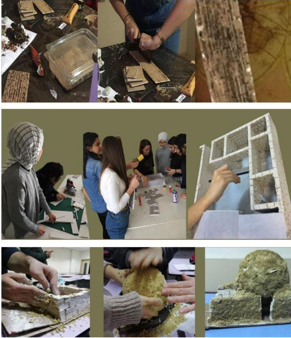
Şekil 3. Maket yapım süreci (Durukan, 2020)