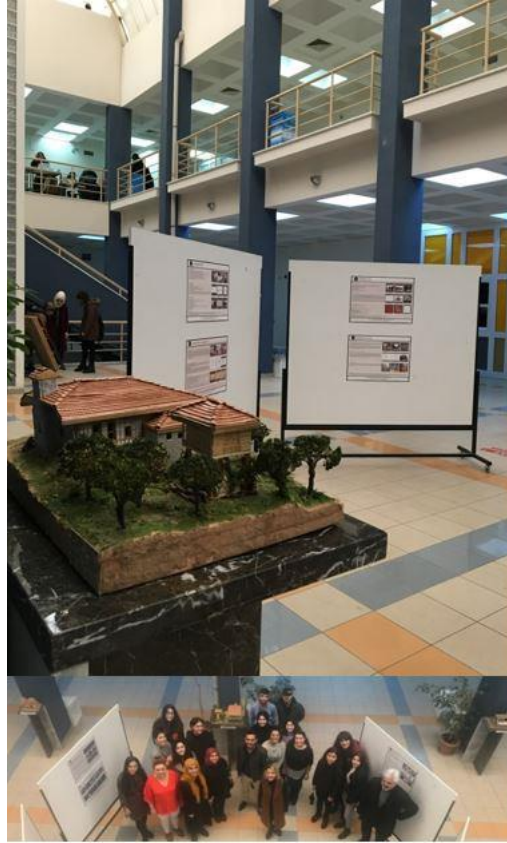
Şekil 11. Akdeniz Üniversitesi Mimarlık Fakültesi İç Avlusu Kalıcı Sergi