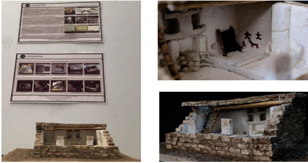
Şekil 5. Çatalhöyük Konutu araştırma raporu ve maketi (Görkem Özdemir, Neşem Bolat ve Nimet Gezginç'e ait çalışma)