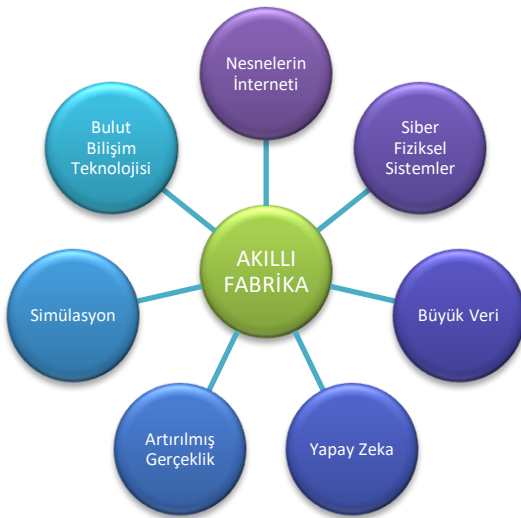
Şekil 2. Akıllı fabrika bileşenlerinin şematik gösterimi

Akıllı fabrikayı oluşturmak için gerekli olan bileşenler Şekil 2’deki gibidir ve en temel bileşenlerden biri Nesnelerin İnterneti (IoT) kavramıdır.