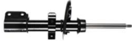
Şekil 4. Strut tip amortisör

Amortisörler burçlu lastik, silindir borusu, hidrolik yağ, gövde borusu, alt kapak, yüzük, piston kolu, toz borusu kapağı, keçe, tüm kılavuz, durdurucu pul, segman, tüm piston valfi, tüm taban valfi ve toz borusu gibi parçalardan oluşmaktadır. Üretimde ileri imalat sistemleri metodolojisi kapsamında, sürdürülebilir metodolojilerle inovatif bir imalat süreci adapte edilmeye çalışılmaktadır.