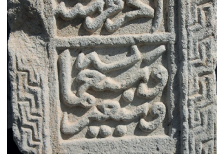
Resim 48. 296 nu

Zencirek (Resim 48): İki tarihli üç örneğinde de (kat.225 (1300?), 250, 296 (1368), kenar suyunda görülür. Beyşehir'de 1364, 1375 tarihli sandukalarda kuşak (Kunt vd 2014: 378-380), Niğde şehrindeki 1372 tarihli sandukada kenar suyu (Bağcı 2005: 28, örn.3), Konya'da 1474 tarihli sandukanın oturtmalığında (Başkan 1996: kat.22), Bursa'daki 1421 tarihli lahitte, Hıdır Şah (15. yüzyıl) ve Ahmet Çelebi'nin (15. yüzyıl) baş taşlarında, Edirne'de Sitti Hatun'un 1467 tarihli baş taşında, İstanbul'da Saraç İshak'ın 1487 tarihli baş taşında, Kısıklı'da 15. yüzyıldan bir baş taşındaki (Güven 1995: Fot. 71, 175, 181, 213, 271, 315), Tokat'ta 1341, 1408, 1410 tarihli mezar taşlarında (Karamağaralı 1971: Fot. 17, 23, 28) benzer örnekleri, 14-15. yüzyıllarda bu motifin yaygın olduğunu gösteriyor.