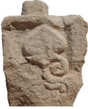
Resim 1. 15 nu

Yüzeyin tek motifle doldurulduğu örnekler (Resim 1-5): Genellikle sandık tipi mezarların kısa kenarlarının dar olan kuzey ve batı yüzleri ile kısa kenarın üstündeki tepelikte işlenmişlerdir. 7 örneği belirlenmiştir (Nu:15, 108, 232, 234, 243, 265, 266). 15 numaralıdaki birimin yan yana tekrarlandığı iki örnek (nu:147, 196) ayrı bir tip altında ele alınacaktır.