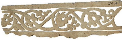
Resim 22. 194 nu