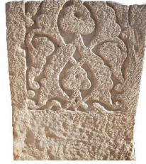
Resim 7. 164 nu (1382)