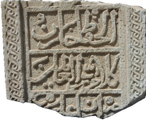
Resim 46. 307 nu