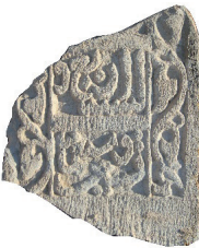
Resim 26. 216 nu

Yazı, kandil gibi ana düzenlemeyi tamamlayan bitkisel bezemeliler (Resim 26-35): Baş veya ayak taşlarında ana düzenleme olan yazıların ve kandillerin çevresi değişik biçimlerde kıvrık dallarla bezenmiştir. Bunların da ana yapısı, “s” biçimli dalın kıvrımları içine yerleştirilen rumilerden oluşur. 10 örnekte belirlenmiştir.