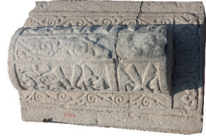
Resim 35. 188 nu

182 numaralı, Ahlat'tan 1293 ve 1320 tarihli iki mezar taşındaki düzenlemelerin devamıdır (Schneider 1989:104-105 /nu:368-369). 188 numaralı örneğimiz, Erciş'te 12. yüzyıla verilen, geniş bir oturtmalığın üstünde yükselen iki eğimli sandukayı andırır (Uluçam 2000: 24, E-29/ Fot. 143-146).