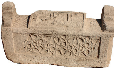
Resim 55. 223 nu.

Yıldız geçmeleri Beylikler dönemi mimarisinde de yaygınlığını sürdürür (Görür 2002). Malatya'daki 8, 10 ve 12 kollu yıldız geçmeli üç örnek kırık olduklarından tarihlerini bilmiyoruz. Tarihi bilinenlerin tamamı 14. yüzyıldan olduğu için bunları da aynı yüzyıla verebiliriz. Kol sayılarının azalması bakımından Ahlat'taki eğilime uygundurlar. Ancak sayıları azdır, işçilikleri döneminin mimarisine benzer ve belirli bir kaliteyi tutturmakla birlikte Ahlat'takiler daha iyidir. Çok kollu yıldız, Bağdat Köşkü'nden (1639) başlamak üzere Cumhuriyet dönemine kadar ahşap tavanlarda yaygınlığını sürdürmüştür (Çal 2008:159). 223 nu.lu örneğimizdeki gibi, İran Meraga Müzesi'ndeki taş sandukaların yan yüzlerinde, 8, 10, 12, kollu yıldız geçmesi işlenenlerden biri 1572 tarihlidir. Diğerlerinin tarihi belirtilmemiştir (Baş 2007).