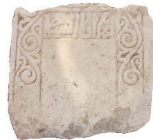
Resim 29. 231 nu