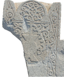
Resim 31. 304 nu