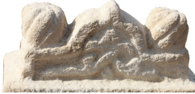
Resim 4. 265 nu