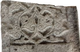
Resim 9. 313 nu