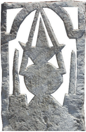
Resim 87. 189 nu (1308)