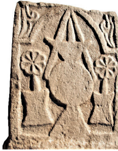
Resim 82. 162 nu (1359)