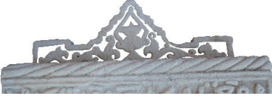
Resim 30. 293 nu