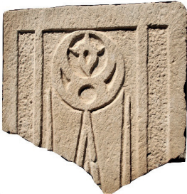
Resim 90. 221 nu