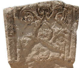
Resim 11. 89 nu