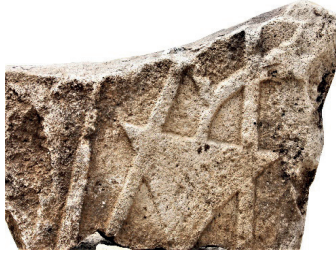
Resim 76. 2 nu