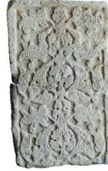
Resim 8. 109 nu