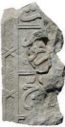
Resim 49. 306 nu

Yanları uzun uç uca altıgen tekrarları (Resim 49): Kenar suyu olarak tek örnektedir (kat. 306). Bu tür bezeme 19. yüzyılda ev tavanlarında yaygınlaşır.