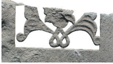
Resim 15. 301 nu