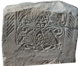
Resim 38. 155 nu