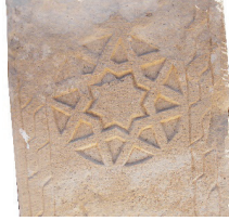
Resim 53. 225 nu