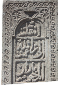
Resim 47. 184 nu