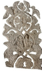
Resim 10. 3 nu