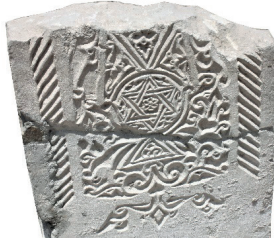
Resim 79. 156 nu