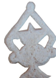
Resim 92. 293 nu