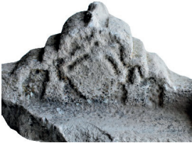
Resim 78. 82 nu