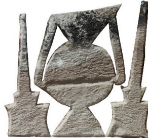
Resim 86. 183 nu