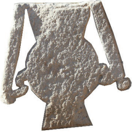
Resim 84. 180 nu