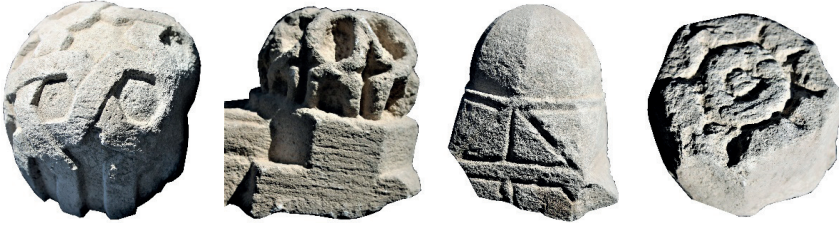
Resim 68. Etüdlük Resim 69. Etüdlük Resim 70. Etüdlük Resim 71. Etüdlük