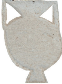
Resim 85. 165 nu