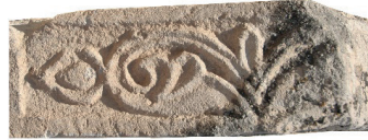
Resim 3. 243 nu