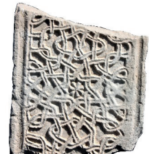
Resim 57. 296 nu