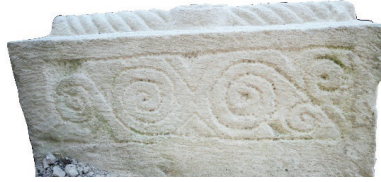
Resim 25. 291 nu

Yazı, kandil gibi ana düzenlemeyi tamamlayan bitkisel bezemeliler (Resim 26-35): Baş veya ayak taşlarında ana düzenleme olan yazıların ve kandillerin çevresi değişik biçimlerde kıvrık dallarla bezenmiştir. Bunların da ana yapısı, “s” biçimli dalın kıvrımları içine yerleştirilen rumilerden oluşur. 10 örnekte belirlenmiştir.