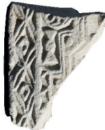
Resim 37. Etüdlük