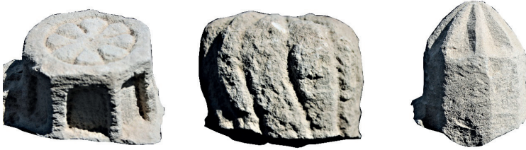
Resim 72. Etüdlük para Resim 73. Etüdlük para Resim 74. Etüdlük para