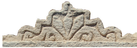
Resim 5. 234 nu

Küçük yüzeylerde yapıldıklarından işçilikleri kötüdür, basitleştirilerek işlenmişlerdir. 243 numaralı örneğimizdeki benzeri Tokat'ta 1422 tarihli mezar taşında yer alır (Karamağaralı 1971: 81).