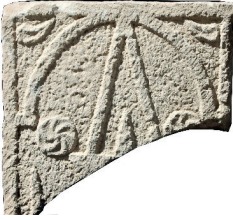
Resim 96. 309 nu