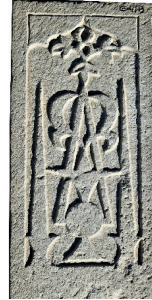
Resim 83. 182 nu (1368)