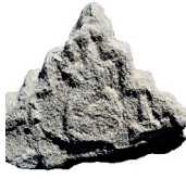
Resim 97. Etüdlük parça