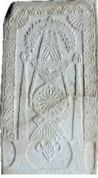
Resim 75. 1 nu

Erciş'te de tarihi bilinen biri 1315 tarihli, biri 13. yüzyıl, dokuzu 14. yüzyıla tarihlenmek üzere 11 örnektekiler genel düzenlemeye uygundur (Uluçam 2000: kat. e12, g26, y61, a76, u83, c8, ad6, ad7, ad5, ad8, ad11, ad12).