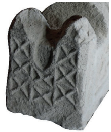
Resim 45. 271 nu

Üst üste yuvarlaklı s kıvrımları (Resim 46-47): İki örneği vardır (kat. 184 (1300?), 307). Birbirini takip eden "s" kıvrımlarının birleşme yerlerinde birer yuvarlak oluşturmasıyla zincire benzeyen bir biçim elde edilmiştir. Kırşehir'deki örneğini de (Karamağaralı 1992: Fot. 20) 14. yüzyıla verebiliriz.