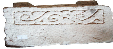
Resim 23. 52 nu