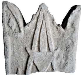
Resim 91. 245 nu