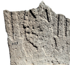
Resim 80. 163 nu (1436)