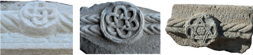
Resim 62. 291 nu Resim 63. (nu.1741 etüdüük) Resim 64. 85 nu

Niğde'de 1407 tarihli sandukada (Bağcı 2005: kat.7), Erciş'te Karakoyunlu dönemine tarihlenen mezarda (Uluçam 2000: kat. G-23), Gevaş'ta 14. yüzyıla verilen iki mezar taşında (Başak 2008: kat.1,4), Tokat'ta 1341, 1408, 1410, 1422 tarihli mezar taşlarında (Karamağaralı 1971: Fot.13,17,23), Göynük'te 1448 tarihli mezar taşında (Çal 2007c: kat.26), Edirne TİEM Sitti Hatun baş taşı (1467) kandil gövdesinde, İst. Kısıklı Camisi baş taşında (15. yüzyıl?) (Güven 1995: Fot.214,325) yer almıştır. Kırşehir'deki sandukada (14. yüzyıl) çarkıfelek daire içindedir, iç dairesi kabara biçimlidir (Göktürk 2008: 195). Çarkıfelek, Anadolu Türk sanatında her dönem yaygın bir motif olmakla birlikte örneklerimizdeki biçimiyle Malatya'ya özel bir tip olduğunu söyleyebiliriz.