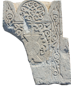
Resim 95. 304 nu