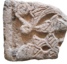
Resim 14. 56 nu