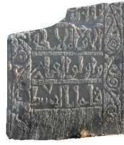
Resim 28. 217 nu