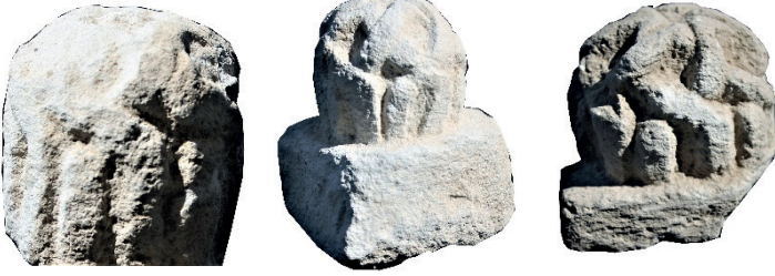
Resim 65. Etüdlük para Resim 66. Etüdlük para Resim 67. Etüdlük para