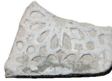
Resim 56. 214 nu