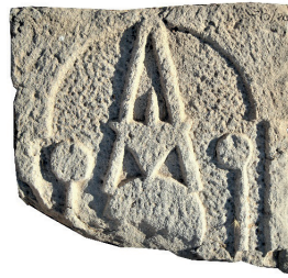
Resim 89. 213 nu