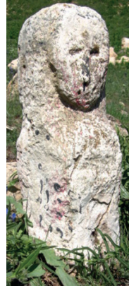
Resim 102. Karamağaralı 1992: 126. Fot. Resim 103. Malatya Akçadağ Derinkuyu Köyü'nden (Fotoğraf Birol Bayram)

İnsan yüzlü güneş Silvan Ebul Muzafferiddin Camisi minaresinde (1212), İncir Han taç kapısında (1238), 1240 tarihli sikkede iki aslanın arasında insan yüzlü güneş olarak, 1240, 1298, 1312 tarihli sikkelerde, 1297-1302 yılları arasında basılmış olabilecek iki sikkede insan yüzü olmayan güneş, olarak verilmiştir. 1293 tarihli sikkede ise büst şeklindeki insan başının çevresinden güneş ışınları çıkar (Çaycı 2002: 42, 44, 52, 53, 54).