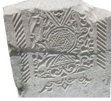
Resim 13. 156 nu