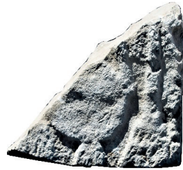
Resim 77. 4 nu