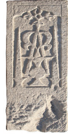
Resim 32. 182 nu (1368)