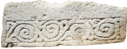
Resim 24. 178 nu