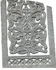
Resim 12. 200 nu