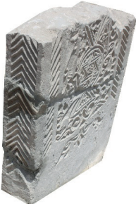
Resim 40. 156 nu

Üst üste tekrarlanmış “w” şeklinde çizgiler (Resim 42): 106, 111 (1375 tarihli), 223, 271 (1391 tarihli) örneklerimizde yer verilmiştir. Ankara’da 1356, 1368 (Küçükahmet 2009: kat. 16, 18) Beyşehir’de 1375 (Kunt vd 2014:378) tarihli sandukalarda kuşak olarak, Erciş’te 14. yüzyıla tarihlenecek yuvarlak? kemerli sandukanın kemerli yüzünde (Uluçam 2000: 26,AD-19), Bursa Muradiye Türbeleri haziresinde Bahaeddin Ali’nin ayak taşında (1424) (Güven 1995: Fot.75) işlenmiştir.