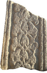
Resim 6. 212 nu

Birincisi rumi - palmetlilerdir. Bu gruba giren 12 örneğin (kat. 3, 56, 89, 109, 156, 164, 184, 200, 212, 298, 301, 313) ana yapıları aynıdır, yalnız ayrıntılarda değişiklikler vardır. Her birimde, bir kökten çıkan iki rumi yaprağı uçta birleşerek palmet, beş çenekli çiçek ve çok dilimli çiçek oluşturur. Ortadaki bu çiçekten çıkan iki kol tekrar iki yandaki birer rumi yaprağını oluşturmak üzere düzen devam eder. Yanlardaki bu rumi kollarından, devamı olmayan yapraklar çıkabilir. 3, 109 numaralılar yan rumi kolları ve ortadaki beş çenekli çiçek bakımından benzerdir. Ancak 109 numaralıda rumilerin ucundan palmete benzer birer çiçek daha çıkar. 313 numaralı ise rumi kollarının arasında bir değil iki palmetli oluşuyla ayrılır. 212 numaralı daha basit işçiliklidir. Palmet ve rumiler ayrıntılı değildir. 184 numaralıda ise ortadaki palmet klasik tiptedir, yalnız yanlardaki yapraklar alışıldık rumilerden farklıdır ve sapların yivli işlenişi ile diğerlerinden daha geç, 15.yüzyıldan gibi görünüyor. 298 numara rumi kolları arası, palmet – karanfil veya gülün üstten görünüşü biçiminde çok dilimli çiçek sıralaması ile düzenlenmiştir. 200 numaralısı da farklı olanlardandır. Küçük ve basit palmeti, iki rumi değil de hatayı üslubuna benzer bir yaprak çevirir. Bunlardan 184 numaralısı 1300?, 164 numaralısı 1382 olmak üzere ikisinin tarihi bellidir.