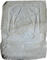
Resim 36. 1 nu

Düşey eksende dizili kesişen yarım daireler (Resim 36): Tek örneği tarihsizdir.