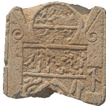
Resim 27. 228 nu