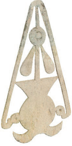
Resim 81. 93 nu