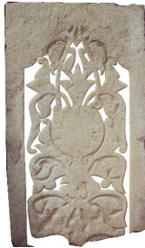
Resim 88. 201 nu