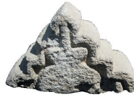
Resim 98. Etüdlük parça