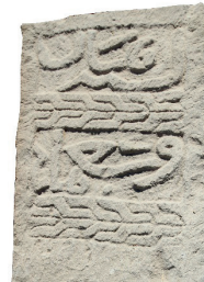
Resim 51. 189 nu

Sekiz dilime bölünmüş yuvarlak (Resim 50): Üç örneği de papatyaya benzer (kat. 158, 279, 302). Sekiz dilimli papatya Akşehir'de 1348 tarihli mezar taşında (Meriç 1936: 179, nu.81), Niğde'de 1407 tarihli sandukada (Bağcı 2005: kat.7), 12 dilimli Kırşehir'de tarihsiz bir örnekte (Göktürk 2008:188, sanduka 5), Ercişte 14. yüzyıldan? (Uluçam 2000: Fot.162),