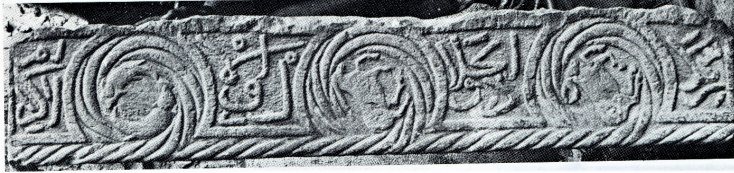
Resim 100. Karamağaralı 1992: Fot. 123

Hayvan figürleri (Resim 100): Vaktiyle Malatya Ulu Camisi'nde olduğu belirtilen ve bugün nerede olduğu bilinmeyen sandık mezar yan taşı olabilecek taşta üç çarkifeğin içindeki balık, oğlak ve boğa figürlerinin burçlara işaret ettiği kabul edilmiştir (Karamağaralı 1992: 29, Fot.123).