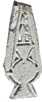
Resim 99. 312 nu

Bunlardan 162 numaralı 1359, 163 numaralı 1436, 162 nu. 1368, 189 numaralı 1308, 295 numaralı 1375 yılından olmak üzere beş tanesi tarihlidir.