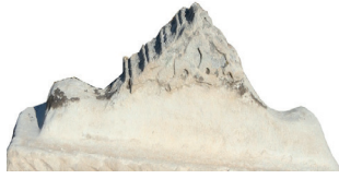
Resim 2. 232 nu