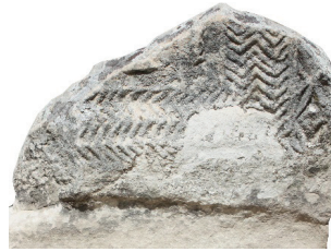
Resim 42. 106 nu