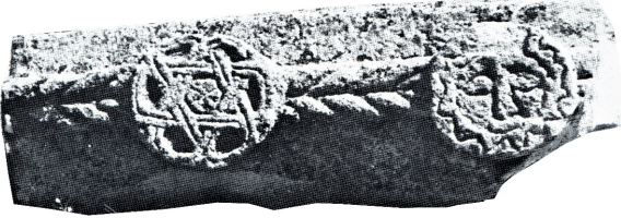
Resim 101. Karamağaralı 1992: Fot. 125

İnsan figürü (Resim 101-102): İkisi de kayıp iki örneğinden birincisi kazıma tekniği ile yapılmıştır. Sandık mezarın kısa kenarı olması gereken ve günümüzde kayıp olan taşta, urgan motifinin ucundaki yuvarlak çıkıntının yüzeyindeki insan yüzüne güneş denilmiş ve 13. Yüzyılın son çeyreği ile 14. yüzyılın ilk çeyreğine tarihlenmiştir (Karamağaralı 1992: 29, Fot.125). Mezarlıkta tarihi bilinen örneklerin çoğunun 14.yüzyıldan olması, bu tarihlemeyi doğrulamaktadır. Bu düzenlemede, insan yüzü ve yan kabarda gül motifi olarak kabul edilen düzenlemede gül gök çarkının, insan yüzü güneşin sembolü olarak kabul edilmiştir (Çaycı 2002: 47).