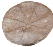
Resim 50. 302 nu