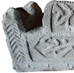
Resim 41. 271 nu