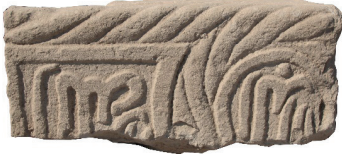
Resim 52. 153 nu

tarihli mezara (İnci 2008: kat.11) bakarak, az da olsa bazı bölgelerde sürdürüldüğünü söyleyebiliriz.