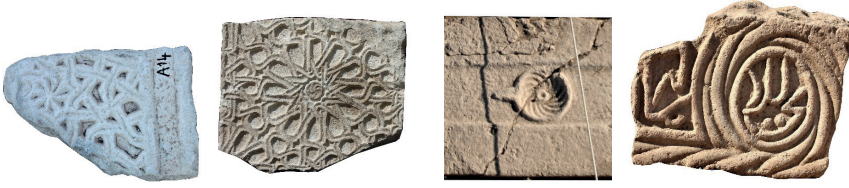
Resim 58. 42 nu. Resim 59. 307 nu Resim 60. 171 nu Resim 61. 97 nu

Yuvarlak çarkıfelek (Resim 60-61): 30 örnek ile Malatya'nın ikinci yaygın grubudur (kat. 24, 36, 51, 53, 61, 62, 67, 68, 70, 80, 83, 88, 90, 92, 95, 97, 99 (1343), 102 (1346), 104, 135, 136, 148, 153, 171, 202, 203, 204, 233, 249, 284). Genellikle açık sandık mezarların yan taşlarının üst ve yan yüzlerinde urgan motifi ile beraber verilmişlerdir.