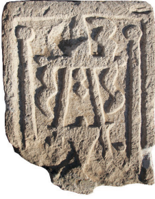
Resim 93. 295 nu (1375)