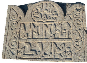
Resim 34. 192 nu