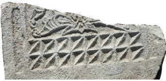
Resim 43. 199 nu

Çapraz iki eksenende bölünmüşler (Resim 44-45): İki örneğimiz de tarihlidir: kat. 243 (1388), kat. 271 (1391). İstanbul Kısıklı'da 15. yüzyıla verilen bir mezar taşında tekrarlanmıştır (Güven 1995: Fot.317). İki alt tipine de benzer daire içinde düzenleme, Sivas Müzesi'nde bir mezar taşındadır (14. yüzyıl?) (Karamağaralı 1992: 11, Fot.34) Zile Şeyh Nusret Türbesi (1353 tarihli vakfiyesi var) revak direğinin ağaçtan yastığına oyulmuş benzer motifler, bu tipin 14. yüzyıla kadar indiğini gösteriyor (Çal 1987:431). Özellikle ağaçtan yapı elemanlarında ve Erzincan'daki 1905 tarihli örneği itibarıyla (Çal 2007a:132) taştan mezarlarda Cumhuriyet dönemine kadar yaygın olduğunu söyleyebiliriz.