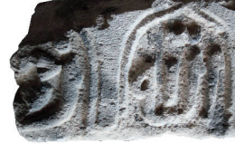
Resim 54. 114 nu

Sekiz uçlu yıldız (Resim 53): İki örneğinden biri 1300? yılındandır (kat. 225) diğerini de (kat. 242) 14. yüzyıla verebiliriz. Bu tür çok uçlu yıldız düzenlemesi, Selçuklu ve Beylikler dönemlerinde, çok kollu yıldızlara göre oldukça azdır. Sekiz köşeli yıldız Türk sanatında geç dönemde yaygınlaşır. Ancak burada olduğu gibi bir daire içinde ama bitkisel bezemeye birlikte verilen Kastamonu örnekleri 14-15. yüzyıldandır (Çal 2007b: 215-224). Cizre'de 1893 ve 1895 tarihli mezar taşlarındadır (İnci 2008: kat. 6, 11, 46). Kastamonu'da 1816 tarihli Girişkenler Evi'nde, 19. yüzyıldan Yanıklar Evi, Çatlakoğlu Evi, Çilhacılar Evi'nde (1816) (Çal 2008:157-168), Akseki evlerinde olduğu gibi (Yarar 2001:30,68,77,109,113) 19. yüzyılda tavanlarda çok yer verilmiştir.