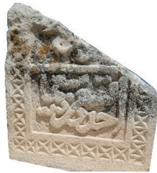
Resim 44. 243 nu