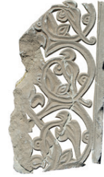
Resim 18. 306 nu (1300?)

Bu gruptan 164 ve 212 numaralılara daha çok benzeyenleri, Niğde Sungur Bey Camisi mihrabı (1335), Erzurum Çifte Minareli Medrese taç kapısı (1291), Erzurum Yakutiye Medresesi Taç kapısı (1310), Ahlat Erzen Hatun Kümbeti (1396), Niğde Gündoğdu Türbesi Taç kapısı (1344), Niğde Sungur Bey Camisi doğu kapısı (1335), Ahlat mezar taşında (1300) (Schneider 1989:162-163, nu.912-917), Konya'da Karamanoğulları döneminden 1411 tarihli sandukanın kısa kenarında (Başkan 1996:kat nu: 10) yer alır. 109, 301, 313 numaralı örneklerimiz kök kısmı itibarıyla Beyşehir'de 1375 tarihli sandukanın kısa kenarındaki (Kunt vd. 2014: 379) düzenleme gibidir. Karamanoğullarından 1442 tarihisinde ise sandukanın yan yüzünde (Başkan 1996: kat. Nu:17), Amasya'da 1440, 1442 tarihli mezar taşlarının alınlığında (Aydoğdu 2018: kat.11-12) bu düzenlemenin tek birimi görülür.