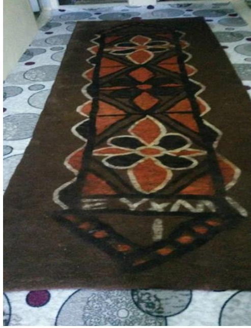
Foto 3. Keçe ustası Ahmet Topdemir'in geçmişte yaptığı ve günümüze gelen tek keçe yer yaygı örneği.