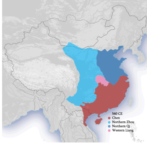
Harita 6. Kuzey ve Güney hanedanları (420-589) devri. Güney ve Kuzey hanedanlıklarının topraklarının 560 yılındaki durumuna dair harita. Açık Mavi: Kuzey Cou Hanedanlığı/İmparatorluğu; Mavi: Kuzey Çi Devleti; Pembe: Batı Liang Devleti; Kırmızı: Çin Devleti'dir.

https://zh.wikipedia.org/wiki/File:Southern_and_Northern_Dynasties_440_CE.png 25 Haziran 2010 tarihinde erişildi.