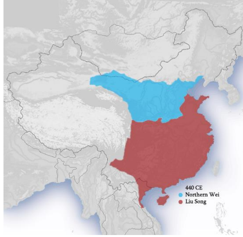
Harita 5. 440 yılında Çin'de Güney ve Kuzey Hanedanları Devri Haritası