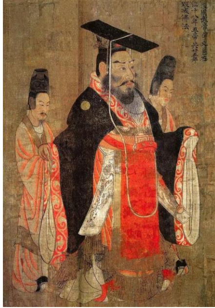
Resim 2. Kuzey Cou Tabgaç Hanedanlığı ve Çin İmparatoru Wudi/Yüwen yong 宇文邕

Kuzey Cou İmparatoru Vu, Çin kaynaklarına göre Çin tarihinde Budizm ile mücadele eden bir şahsiyettir. O, pek çok Budist tapınağını ve Buda heykelini yıktırması ve halkının refah seviyesini iyileştirmek için mücadelesiyle bilinen güçlü bir hükümdar olarak tarihe geçmiştir.