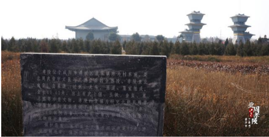
Fotoğraf 4. Şiao aile mezarlığına sonradan dikilmiş taş kitabenin arka kısmı