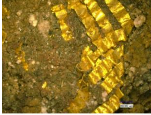
Resim 5. İmparatoriçe Asena'nın Şiao aile mezarlığından çıkarılan altın folyo şeritler (Wang He 王贺 2012, s. 73).

Altın iplik, çeşitli insan ve hayvan heykelleri, toprak ve porselen eşyalar, çeşitli süs ve takı eşyaları, değerli cam boncuklar gibi buluntular, tarihî kıymeti pek yüksek kültürel değerlerdir. Kuzey Cou İmparatoru Vu ve İmparatoriçe Asena'nın mezarının yağmalandığını göz önünde bulundurursak tarihî kalıntıların daha fazla olduğunu tahmin edebiliriz. Nitekim İmparatoriçe Asena'nın aile mezarlığının yağmalanmasından sonra İmparator Vudi ve Asena'ya ait tabutlarda altından yapılmış birkaç süs parçası, mezar içinde yapılan resmî kazıda bulunmuştur. İmparator'un tabutunun yakınlarında, mezarın batı tarafında, üç adet altın tüp şeklindeki cisim (2,3 cm boyunda ve 0,9 cm çapında) ve doğu tarafında İmparatoriçe'nin tabutunun yakınında dokuz adet altın çiçek yaprağı bulunmuştur. Araştırmacı Wu Juiman'e (2010, s. 50) göre altın çiçek yaprakları ve altın çiçekler, başa takılan süslerin parçaları olabilir.