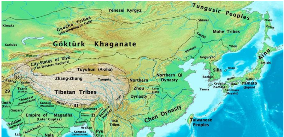
Harita 2. Göktürk Devleti kurulduktan sonra MS 565 yılında Asya ve Çin’de Kuzey Cou Tabgaç İmparatorluğu.