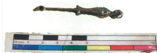
图二 鍍金铜耳勺 (XL047)

Resim 3. İmparatoriçe Asena'nın Şiao aile mezarlığından çıkan altın kaplama kulak temizleme kaşığı (Wang He 王贺, Mei Jianjun 梅建军, Pan Lu 潘路, Yang Junchang 杨军昌 ve Zhang Jianlin 张建林, 2013, s. 130).