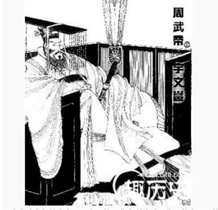
Resim 1. Cou İmparatoru Vu 武帝 / İmparator Yüven Yong 武帝宇文邕 / Tabgaç dilinde adı Miluotu (彌羅突/禰羅突) / http://www.qulishi.com/huati/beizhouhdlb

Göktürk Devleti'nin kurulma arifesinde MS 550/551 yılında doğan Göktürk Prensesi Asena, babası Mukan Kağan Doğu Göktürk Devleti'nin hükümdarı olduğunda 3 yaşındaydı. Göktürk Devleti'nin ilanından kısa bir süre sonra Çin'in kuzeyinde kurulan Kuzey Cou Tabgaç Hanedanlığı İmparatoru ve Kuzey Çin'de hâkimiyet kuran beylik ve devletleri kendi hâkimiyeti altına alan Yüven Yong ile evlenerek Kuzey Cou Tabgaç Hanedanlığının imparatoriçesi olmuştur 2 .