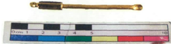
图一 金耳勺 (XL039)

İmparatoriçe Asena'nın mezar buluntuları içinde altın taç, altın mühür, altın şeritler, altın elbise, altın süs objeleri, altın kaplama bronz makas, altın kaplama bronz cımbız, altın kaplama bronz kulak temizleme kaşığı da vardır.