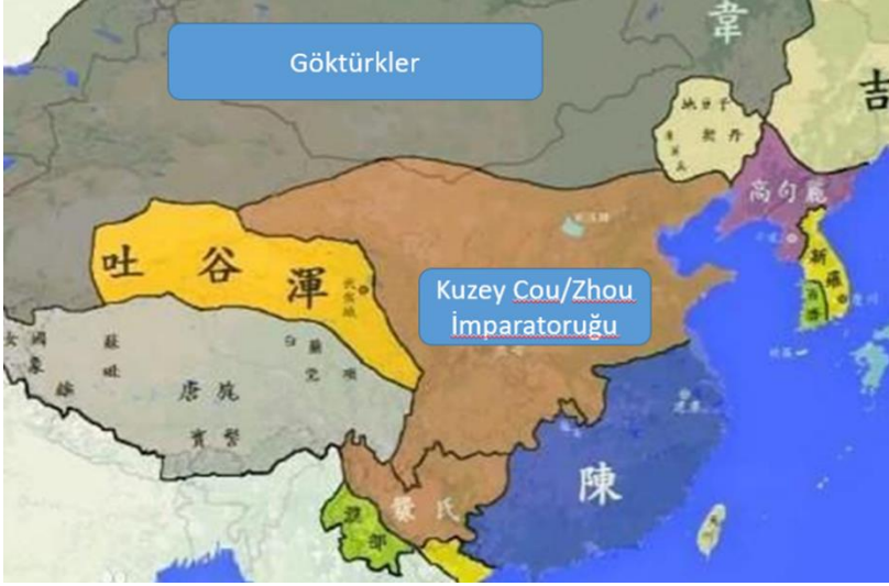
Harita 3. Gök Türk Devleti ve Kuzey Cou Çin İmparatorluğu komşu iki devlet. Kuzey Cou İmparatorluğu'nun Kuzey Çi Devleti'ni yok ettikten sonraki haritası ( Baidu Baike 百度百科)

ve Çin'in kuzeyindeki devletleri tek çatı altında birleştirdi. İmparator Vu'nun ölümü üzerine 578 yılında oğlu Yüven Yun (Yuwen Yun 宇文贇), 579 yılında da Yüven Yan (Yuwen Yan 宇文衍) tahta geçti. İmparator'un kayınpederi olan Naip General Yu Yangcien (Yu Yangjian 於楊堅/杨坚), 4 Mart 581 tarihinde genç İmparator Cing'i (Jing 靜帝) tahttan uzaklaştırarak Kuzey Cou Hanedanlığını ortadan kaldırdı ve devletin adını Sui (Suiler Çin asıllıdır) Hanedanlığı olarak değiştirdi.