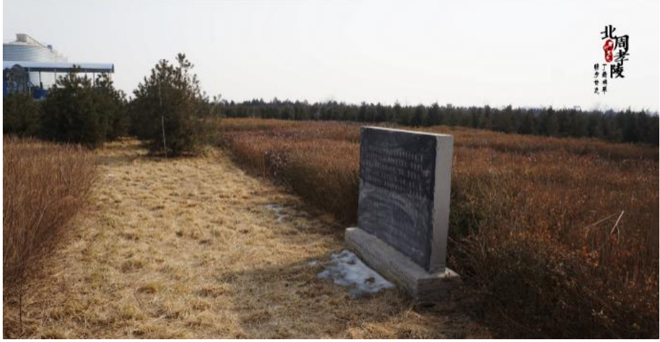
Fotoğraf 5. Daha önceki ziyaretlerinde orada bir fabrika gören sevgililer, bu seferki ziyaretlerinde fabrika ile anıt mezarın belirgin bir şekilde yakınlaştığını görürler. Bu durum ise “mezarın yerinin değiştirilmiş olma” ihtimalini akıllara getirmektedir.