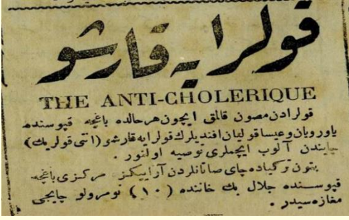
Şekil 3. Anti-Kolerik Çay Reklamı