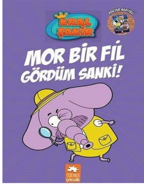
Şekil 1. Kitap Kapağı; Mor Bir Fil Gördüm Sanki, 2019

(2014: 12)’de belirttiği gibi “kullanılan kâğıdın mat ve dayanıklı olması yazıların rahatça okunabilmesine ve resimlerin kolayca takip edilebilmesine olanak sağlamaktadır.”