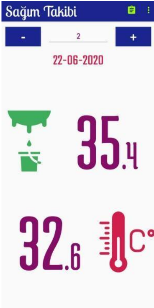
Şekil 5: Son Yapılan Sağım Takip Ekranı.

Seçilen inek ID'si ile veri tabanına istekte bulunulur. Yanıtlanan istek uygulama arayüzü üstünde gösterilir (Şekil 5). Seçilen sağım ineğine ait son yapılan sağım tarihi, miktarı ve sıcaklığı olarak kullanıcıya gösterilir.