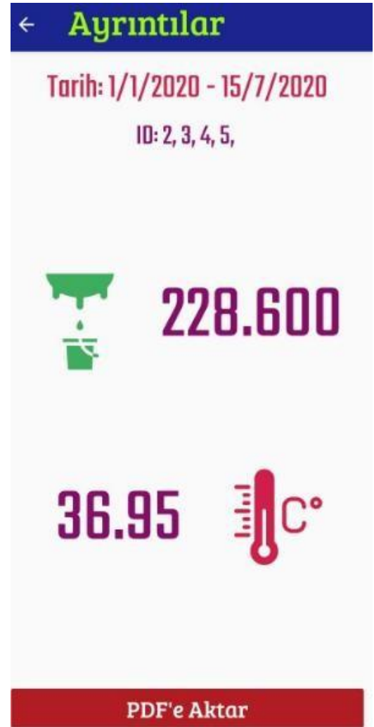
Şekil 6: Tarih Aralığına Göre Filtreleme.

Seçilen inek ID'si ile veri tabanına istekte bulunulur. Yanıtlanan istek uygulama arayüzü üstünde gösterilir (Şekil 5). Seçilen sağım ineğine ait son yapılan sağım tarihi, miktarı ve sıcaklığı olarak kullanıcıya gösterilir.