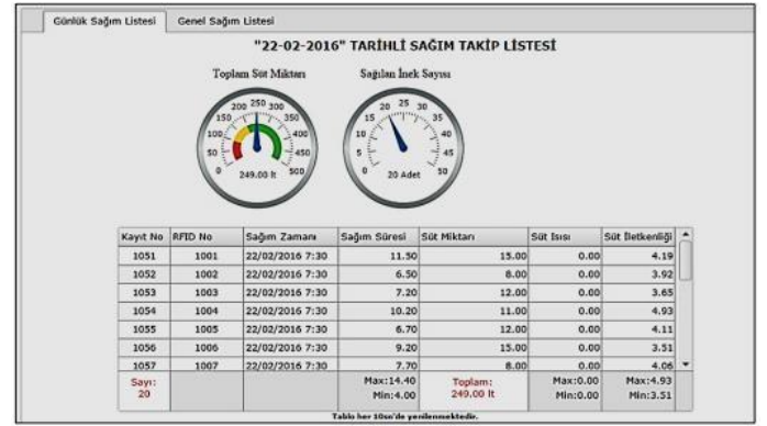
Şekil 1: Onur,S.'nin yaptığı Anlık Sağım Takip Ekranı.[4]

Onur, S. sağım hayvanlarının tanımlanması ve bireysel süt verimlerinin takip edilebilmesi amacıyla —Süt ölçüm ve takip istasyonu için otomasyon yazılımı geliştirmel adlı projeyi yapmıştır. Elektronik temassız süt ölçer cihazı ile elde edilen veriler Wi-Fi aracılığıyla bir sunucuya aktarılmaktadır. Sunucu üzerinde geliştirilen web-tabanlı yazılım bu verileri işlemektedir. Onur, S. bu sistemde PHP, MySQL, JQuery gibi yazılım teknolojilerini kullanmıştır. Çalışma sonunda sistem sağım verilerini otomatik olarak kaydeder ve süt verimlerinin günlük, haftalık, aylık olarak izlenmesini sağlar.[4]