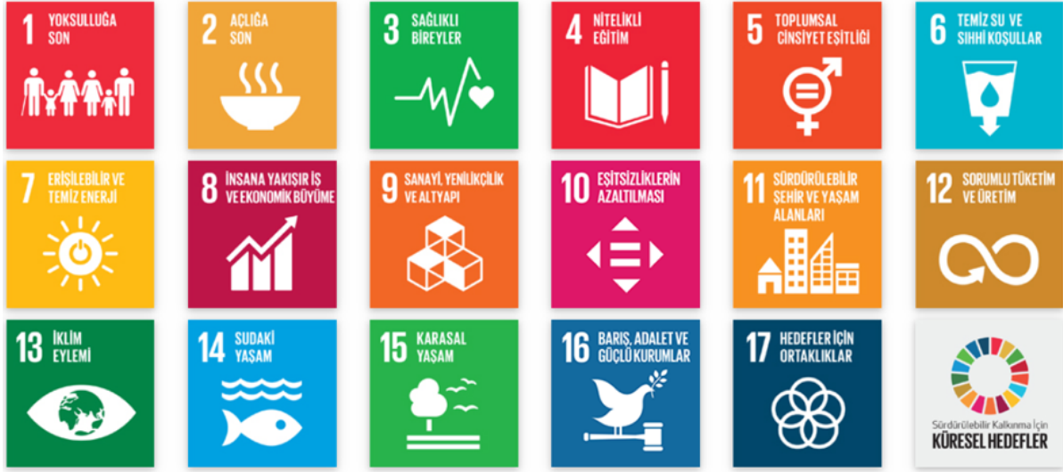
Şekil 2. Birleşmiş Milletler Küresel Sürdürülebilir Kalkınma Hedefleri

artırmak ve yoksulluğu azaltmak için daha yenilikçi bir yaklaşımlara ihtiyaç duyduğunu göstermektedir.