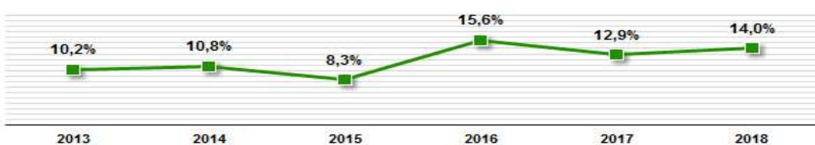
Рисунок 1. Валовой объем ПИИ в экономику Казахстана в целом и в разрезе отраслей (в млрд.долл.США)

Соотношение валового ПИИ к ВВП Казахстана (%)