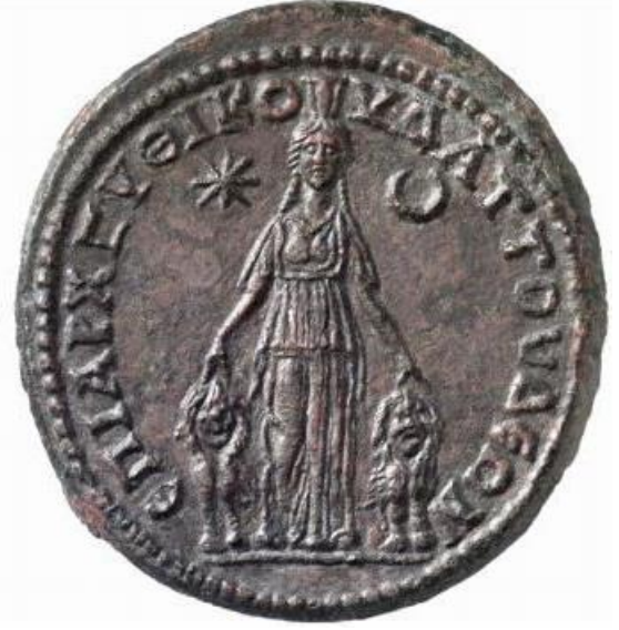
Figür 6: İmparator Septimius Severus Dönemi'ne (MS 193-211) ait sikkenin arka yüzünde hilal ve sekiz şualı yıldız ile birlikte betimlenen Meter Adrastos .