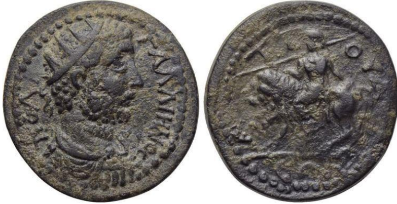
Figür 11: İmparator Gallienus Dönemi'ne (MS 253-268) ait sikkenin arka yüzünde betimlenen Meter Adrastos .