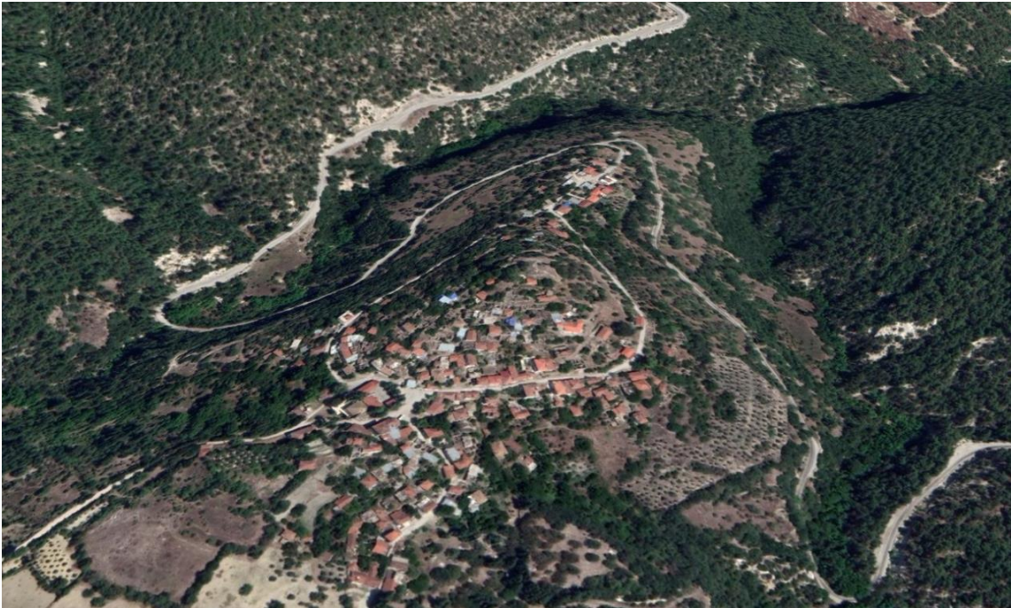
Figür 2: Attouda ve Hisar mahallesinin uydu fotoğrafı.