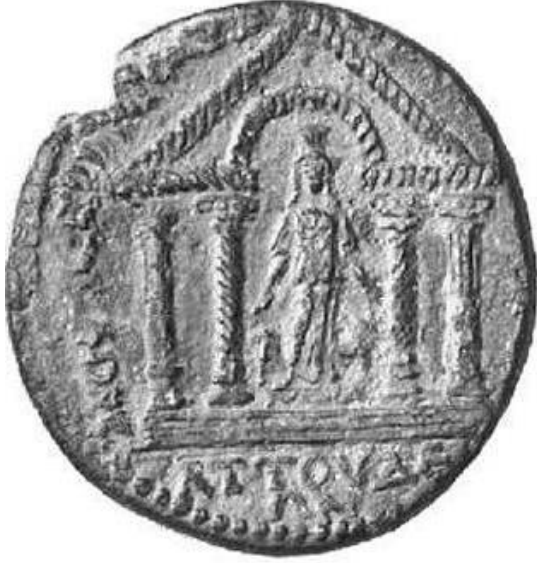
Figür 12: İmparator Septimius Severus Dönemi'ne (MS 193-211) ait sikkenin arka yüzünde betimlenen tetrastyle planlı tapınak ve Meter Adrastos kült heykeli.