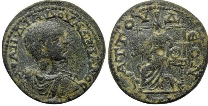
Figür 10: İmparator Diadumenian Dönemi'ne (MS 217-218) ait sikkenin arka yüzünde betimlenen Meter Adrastos .