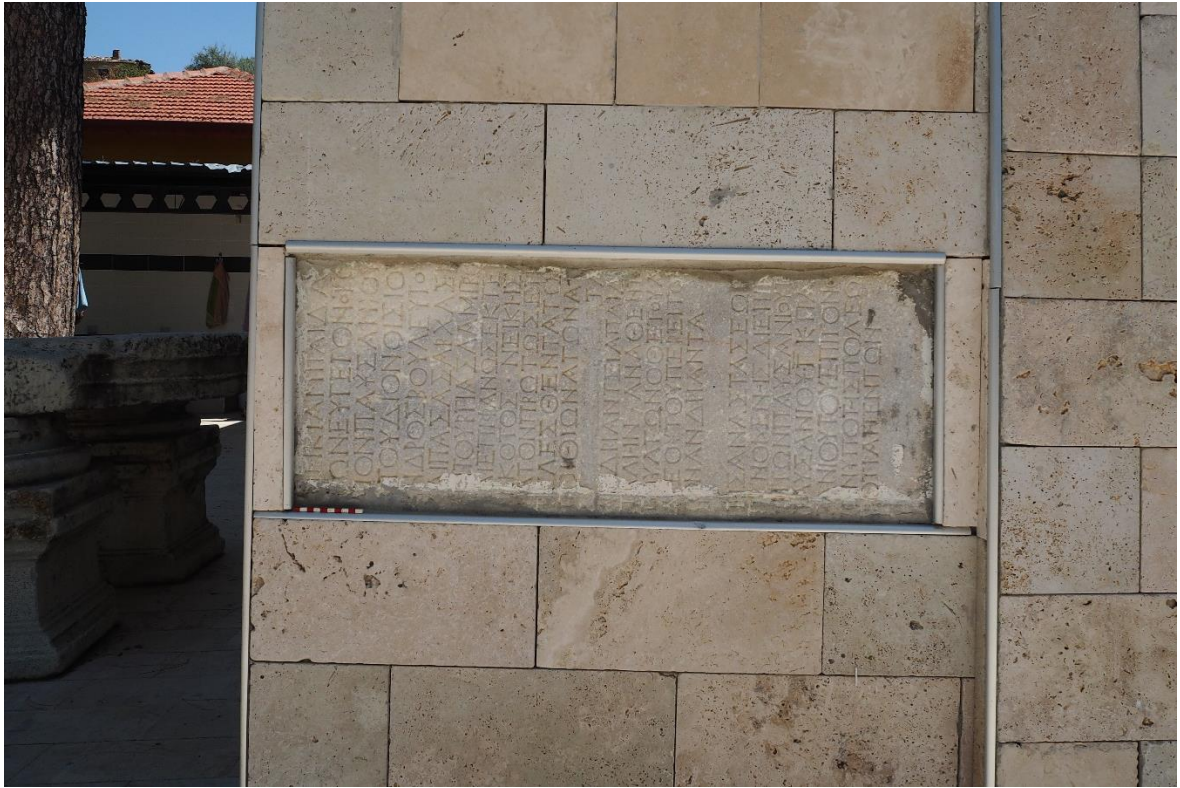
Figür 4: Hisar camisinin duvarında kullanılan yazıtlı blok.