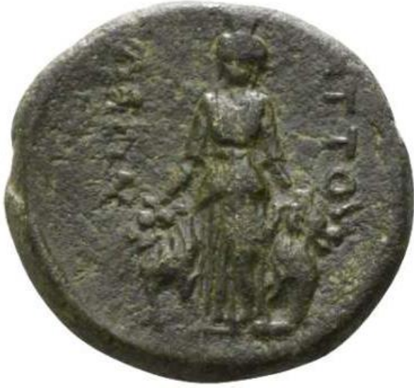
Figür 5: İmparator Augustus Dönemi'ne (MÖ 27-MS 14) ait sikkenin arka yüzünde betimlenen Meter Adrastos .