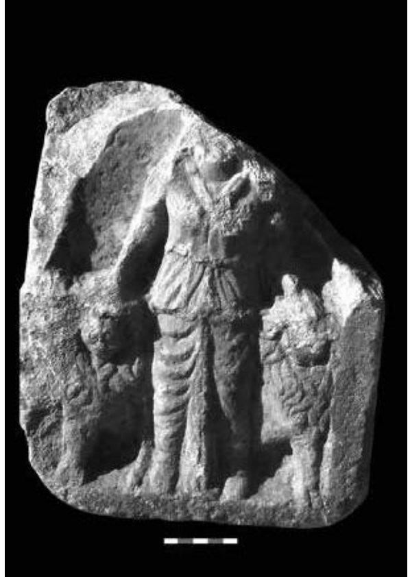
Figür 8: Attouda'da bulunan Meter Adrastos betimli mermer adak kabartması.