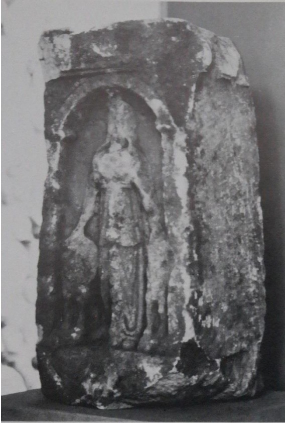
Figür 7: Aphrodisias'ta (Bingöç Köyü) bulunan ve Meter Adrastos 'un betimlendiği mermer adak kabartması.