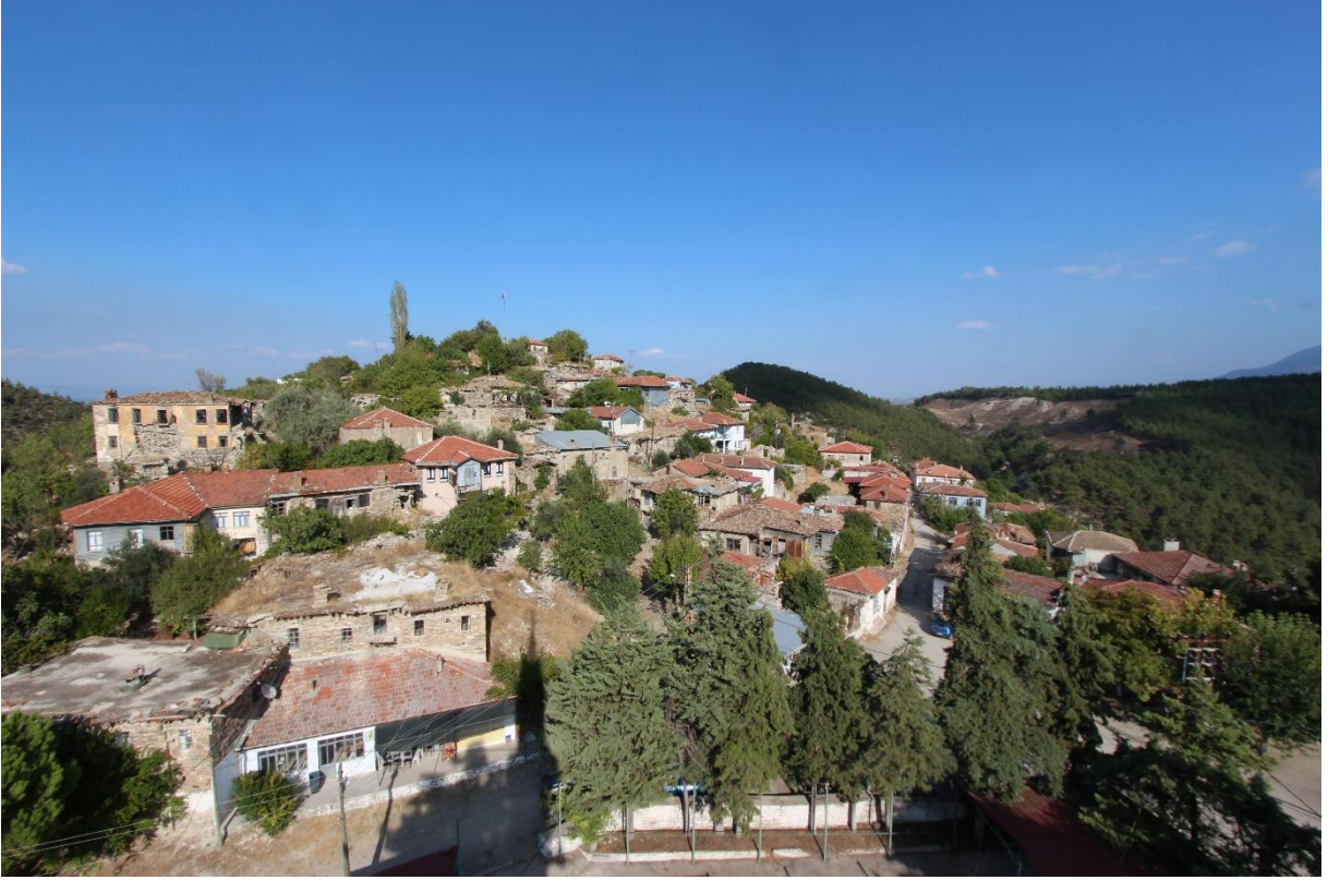
Figür 3: Attouda kentinin üzerine kurulan Hisar Köyü yerleşimine ait konutlar.