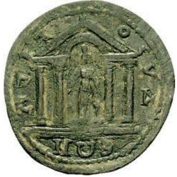
Figür 13: İmparator Severus Alexander Dönemi'ne (MS 222-235) ait sikkenin arka yüzünde betimlenen tetrastyle planlı tapınak ve Meter Adrastos kült heykeli.