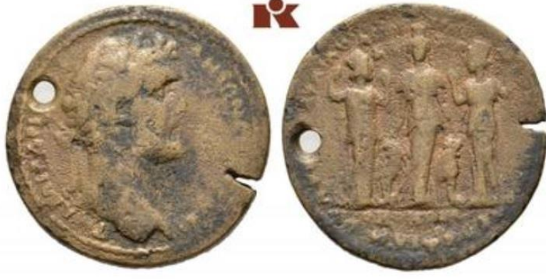
Figür 9: Homonia sikkesinin arka yüzünde betimlenen Meter Adrastos ve iki yanında Attouda ve Trapezopolis Tychesi. (İmparator Antonius Pius Dönemi, MS 138-161)