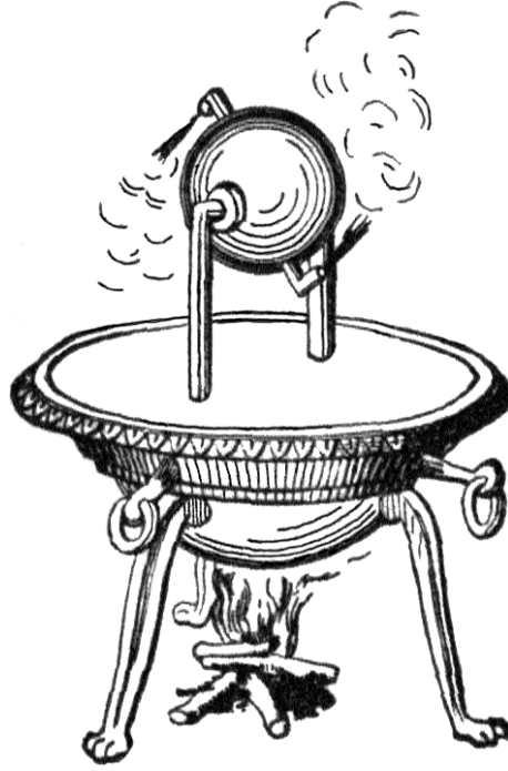
Şekil 1. Heron'un buhar türbinini şekli (Yörükoğulları vd., 2013).

Heron'un buhar türbini 3 ayrı bölümden oluşmaktadır. Birinci bölüm katı yakıtın yakılarak kazan içerisindeki suyun sıvı fazdan buhar fazına geçirildiği ünedir. Bu kısım, yakıt içerisindeki biyo-kimyasal bağlarla bağlı enerjinin ısı enerjisine dönüştürüldüğü, ısı enerjisinin suya aktarılarak suyun sıcaklığının artırıldığı ve suyun sıcaklığının artışı sonucunda faz değişimi gerçekleştirerek buharın üretildiği bölümdür. Birinci bölümde kızgın buhar formuna dönüşen suyun hacmi arttığı ve kazan içerisinde basınç yükseldiği için, dikey iki adet taşıyıcı boru kızgın buharı yönlendirmekte ve küreye ulaşmaktadır. Bu küre bir rotor gibi tasarlanmıştır. Dikey kızgın buhar taşıma borularına, içerisinden buhar akışına izin verecek ve hareketli bir yapıyla bağlanan kürenin içi basınçla gelen buharla dolmaktadır. Kürenin içi buharla dolduğunda, kürenin üzerinde birbirlerine zıt buhar akışı yapacak şekilde tasarlanmış çıkış kanallarında, hızlı bir buhar çıkışı gerçekleşmektedir. Ortam havasına hızla gönderilen buhar, hava kütesine çarparak bir karşı kuvvet oluşturmakta ve oluşan karşı kuvvelerin, aynı yöne doğru itme kuvveti oluşturması sonucunda dönme hareketi elde edilmektedir.