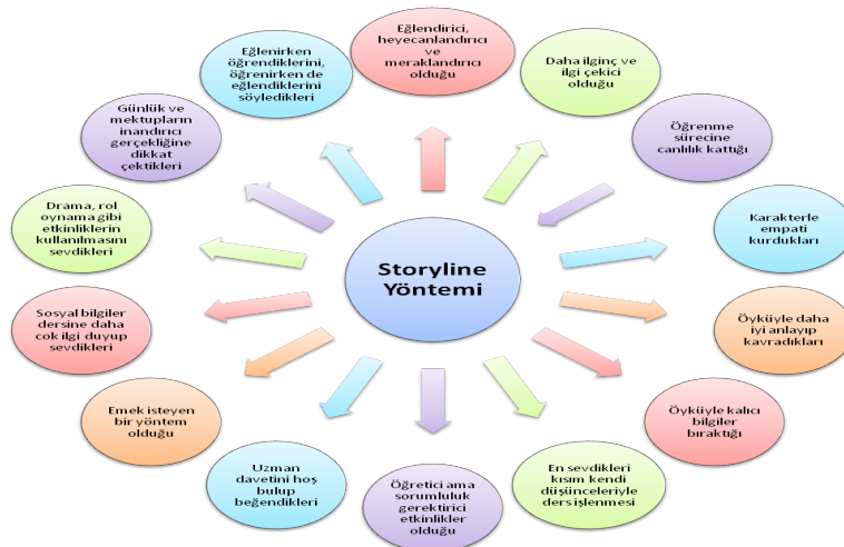
Model 2. Sosyal Bilgiler Dersi Öğrencilerinin Storyline Yöntemine İlişkin Görüşleri

Öğrencilerden storyline yöntemine ilişkin elde edilen bulgular Model 2’de yer almaktadır.