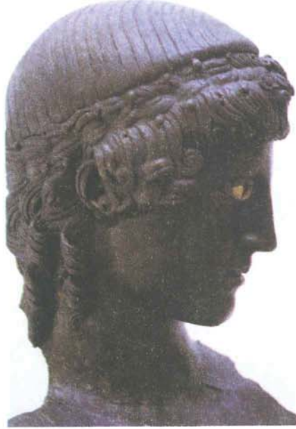
Resim 3 : Heykel, Sađ Profilden BaŐ Detayı; Apollon, Bronz Mustafa Kemal PaŐa, Bursa Műzesi (T. H. Zeyrek)