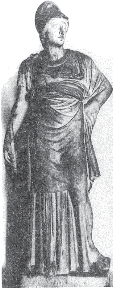
Resim 5 : Heykel, Cepheden; Athena Vescovali Tipi, Mermer St. Petersburg, Ermitage (Schürmann 2000: 41, Res.6)