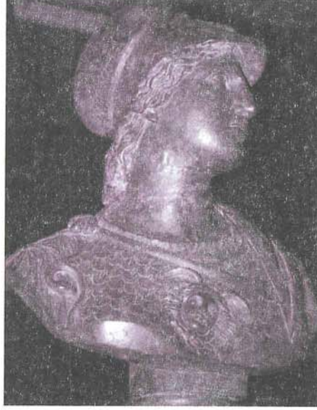
Resim 3 : Büst, Sağ Yandan; Athena, Bronz Mustafa Kemal Paşa, Bursa Müzesi (T. H. Zeyrek)