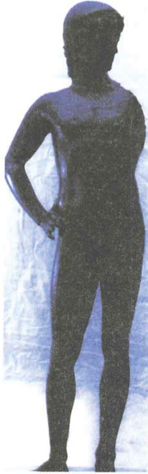
Resim 1: Heykel, Cepheden; Apollon, Bronz Mustafa Kemal Paşa, Bursa Müzesi (T. H. Zeyrek)