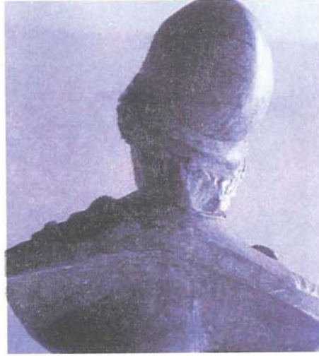
Resim 2 : Büst, Arka Cepheden; Athena, Bronz Mustafa Kemal Paşa, Bursa Müzesi (T. H. Zeyrek)