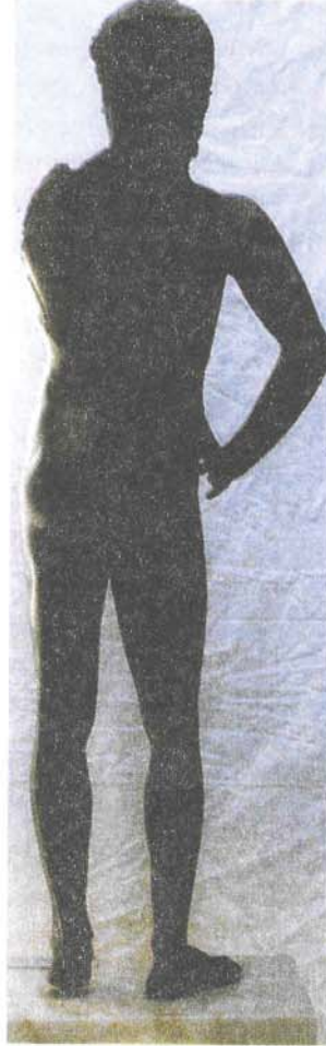
Resim 2: Heykel, Arka Cepheden; Apollon, Bronz Mustafa Kemal Paşa, Bursa Müzesi (T. H. Zeyrek)