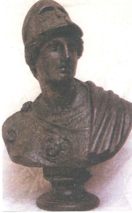
Resim 1 : Büst, Cepheden; Athena, Bronz Mustafa Kemal Paşa, Bursa Müzesi