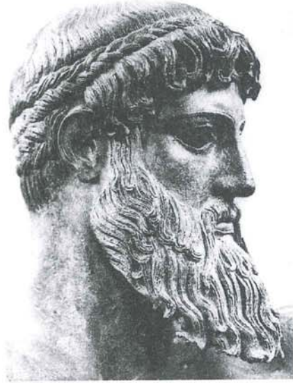
Resim 4 : Heykel, Sađ Profilden BaŐ Detayı; Zeus/Poseidon (?), Bronz Cap Artemision, Atina (Houser 1983:76)