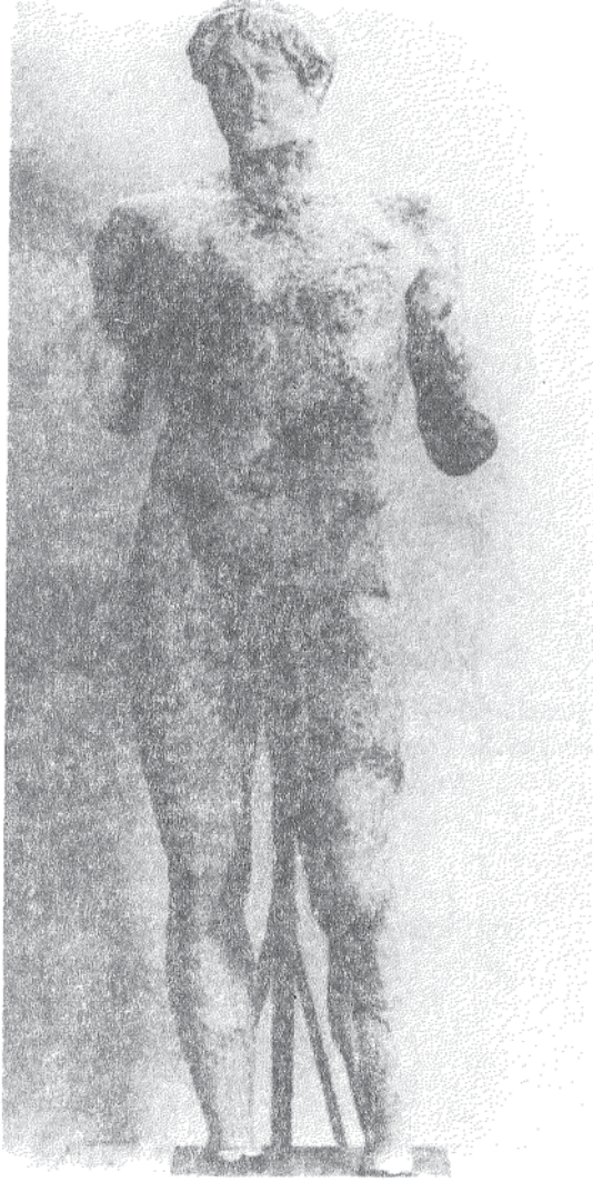
Resim 5 : Heykel, Cepheden; Omphalos Apollonu, Mermer Atina (Ridgway 1984: Lev. 81)