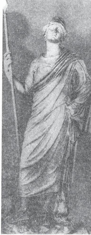
Resim 7 : Heykel, Sol Yandan; Athena Rospigliosi Tipi, Mermer Floransa, Uffizien (Borbein 1971: Lev. 7)