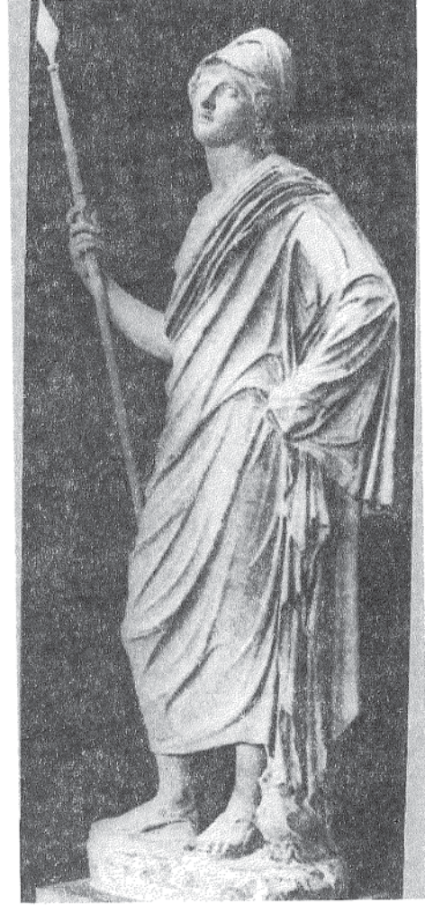
Resim 6 : Heykel, Sol Yandan; Athena Rospigliosi Tipi, Mermer Floransa, Uffizien (Borbein 1971: Lev. 6)