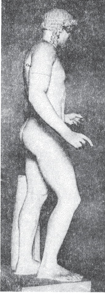
Resim 6 : Heykel, Cepheden; Kassel Apollonu, Mermer Kassel (Studniczka 1907: Lev. 9a)