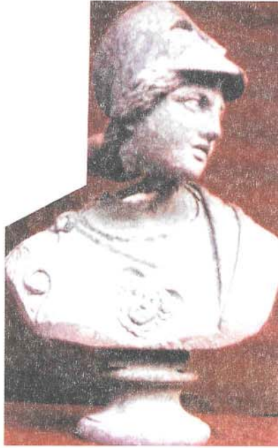
Resim 4 : Büst, Cepheden, Buluntu Durumu: Athena, Bronz Mustafa Kemal Paşa, Bursa Müzesi (T. H. Zeyrek)