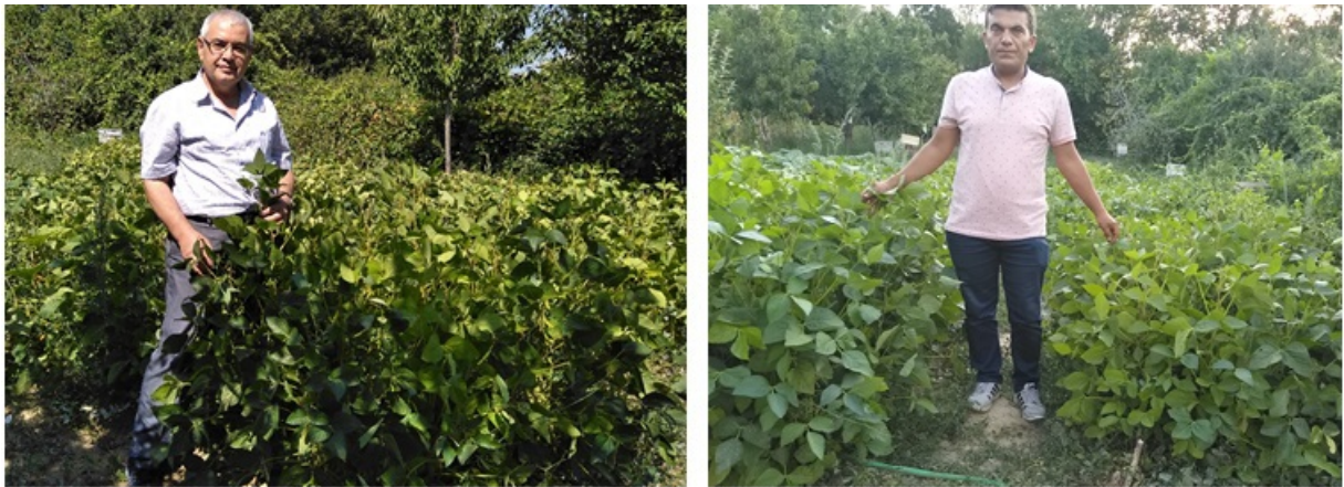
Şekil 5. Deneme alanından bir görüntü