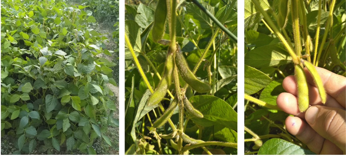
Şekil 4. Yemsoy soya fasulyesi