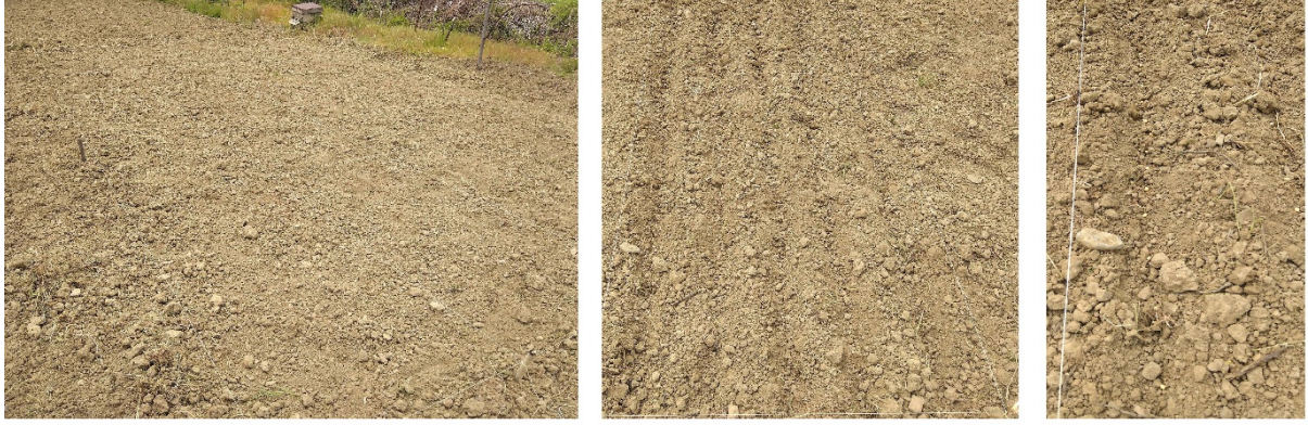
Şekil 3. Deneme yerinin bir görüntü

bölgede tarımı yapılan diğer ürünlere kıyasla ekonomik analizlerinin de ortaya konulması gerektiği düşünülmektedir.