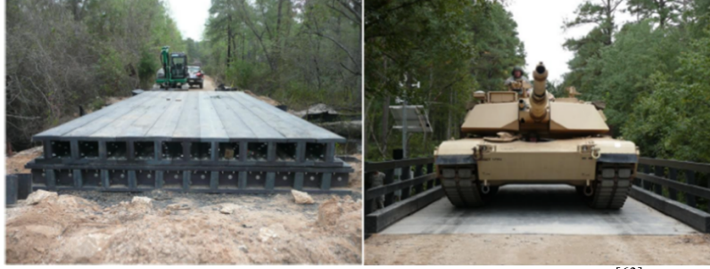
Şekil 1. Atık plastik esaslı kompozit köprü ve M1 Abraham tankının geçişi [63]

kullanılmıştır. Şekil 1’de görülebilen, 2009 yılında Fort Bragg tarafından, Kuzey Karolina’da tamamen bu kompozit malzemeden üretilen 71 tonluk M1 Abrams tankını ve HS25 yüklerini taşıyabilen bir köprü yapımı gerçekleştirilmiştir. Köprüde bu kompozit malzemenin kullanılmasının, çevresel etkisinin düşürülmesi hususunda büyük getirileri olmuştur. Örneğin, plastik atıklardan üretilen bu kompozit malzemenin kullanılmasıyla oluşan enerji kazancı, 22,296 galon benzine eşit olmaktadır. Aynı zamanda bu enerji kazancı, 196 ton karbondioksit salımını engellemiştir. Fort Bragg’dan etkilenen Fort Eustis, Virjinya’da iki eski ahşap demiryolu köprüsünün malzemesini, aynı kompozit malzemeyle değiştirmiştir [63].