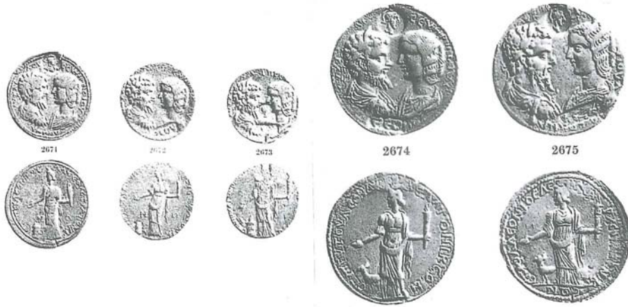
Resim 4-5: Hekate Monoprosopoz figürlü Stratonikeia Sikkeleri (SNG 1962, Lev. 84).