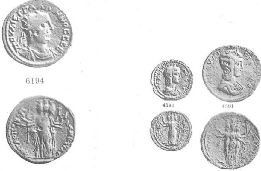
Resim 12: Hekate betimli Ankyra (a) ve Aspendos (b) sikkeleri (SNG 1967, lev-213-SNG 1965, lev. 149).