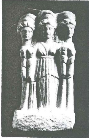
Resim 10: Cepheden üçlü Hekate heykelciği, Phrygia Bölgesi Roma Devri, (İst. Ark. Müzeleri).