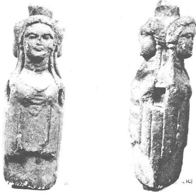
Resim 6: Üçlü Hekate heykelciğinin ön ve yan görüntüleri, Batı Anadolu, Roma Devri (İst. Ark. Müzeleri).