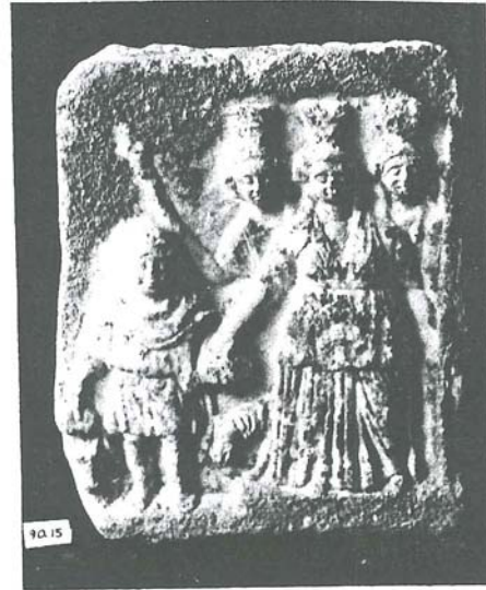
Resim 11: Üçlü Hekale, çocuk Hermes figürlü kabartma Roma Devri, İst. Ark. Müzeleri.