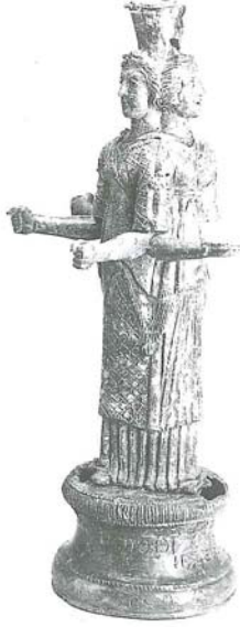
Resim 8: Bronz Hekate üçlü tiplmesi, Adana Roma Devri (Halen Viyana'da müsaderelik)