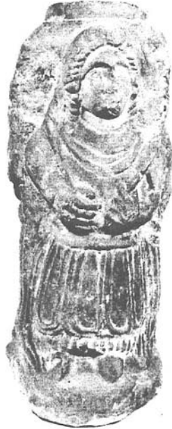
Resim 7: Üçlü Hekate heykelciği, Phrygia Bölgesi, Roma Devri (İst. Ark. Müzeleri).