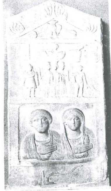
Resim 9: Phryg mezar steli, Soa (Altıntaş) Roma Devri, (İst. Ark. Müzeleri).