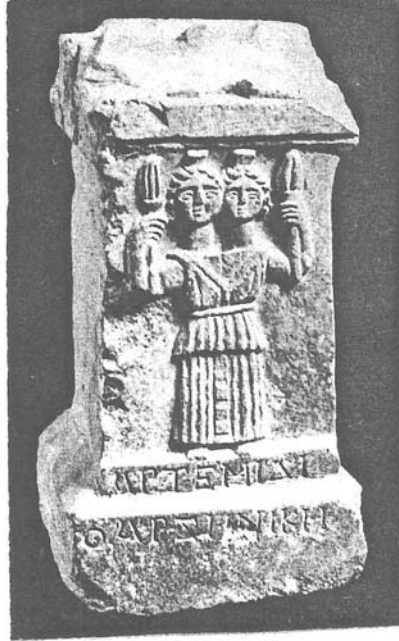
Resim 13: Finike/Arykanda (Arifiye) Artemis-Hekate figürlü sunak, Roma Devri (İst. Ark. Müzeleri).