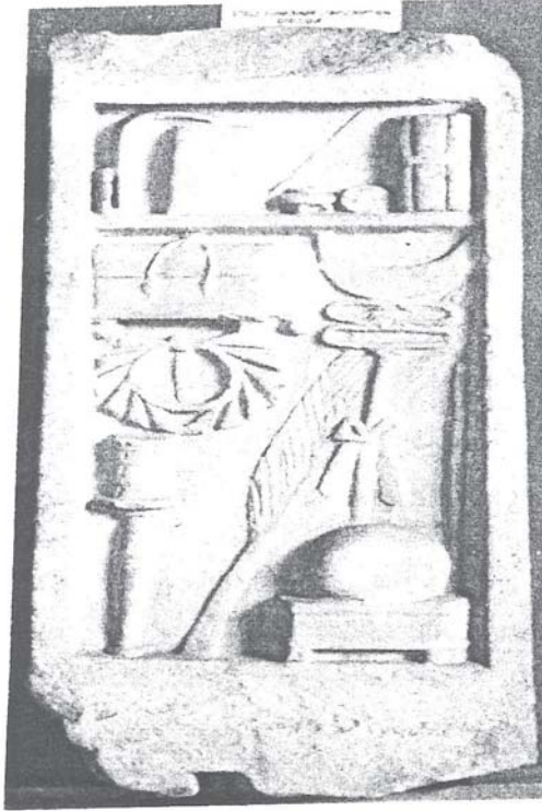
Resim 2: Hekate Phosphoros onuruna yapılan yarışmada derece alan atlet Hekatodoros'un mezar steli, Beyazıt / İst., İ.Ö. 2. yy. (İst. Ark. Müzeleri).