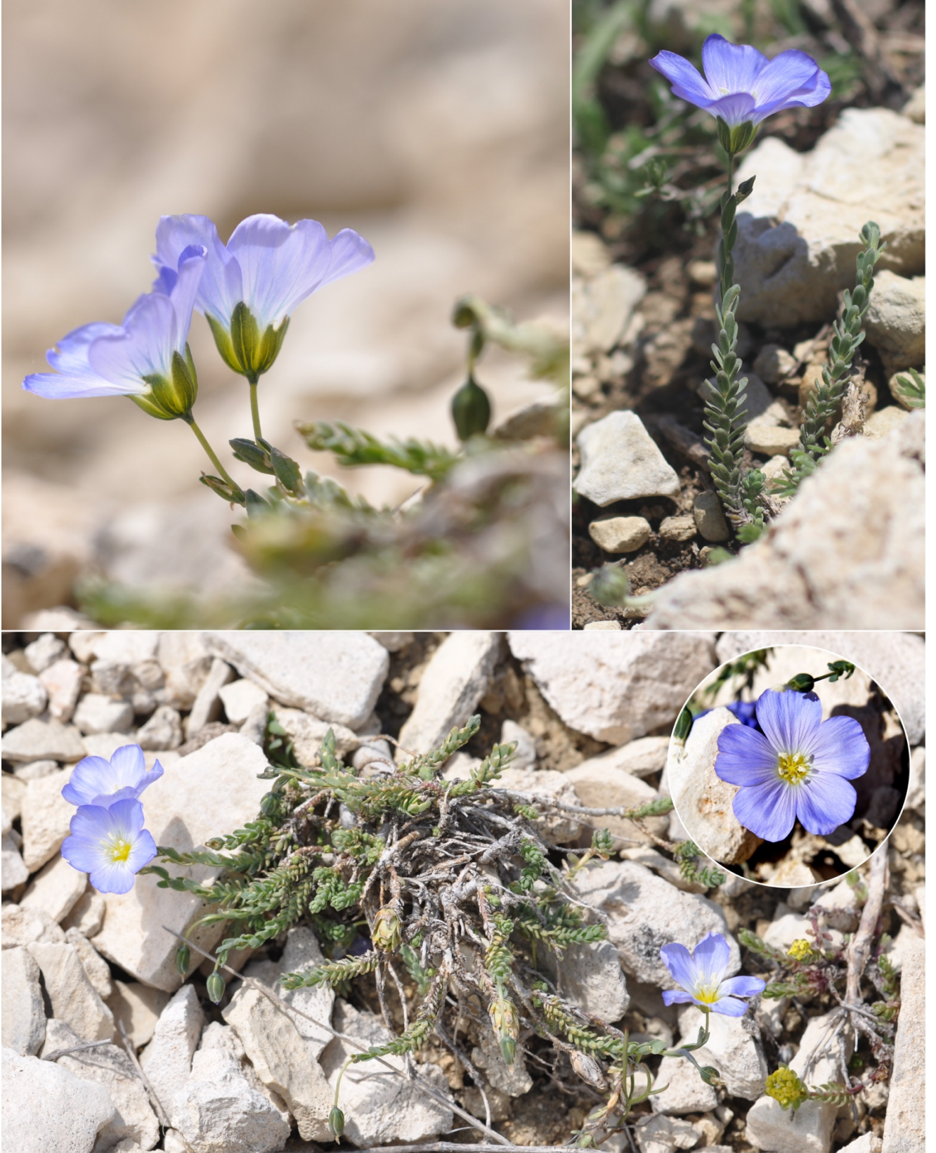
Şekil 1. Linum punctatum subsp. pycnophyllum 'un doğadaki görünümü.