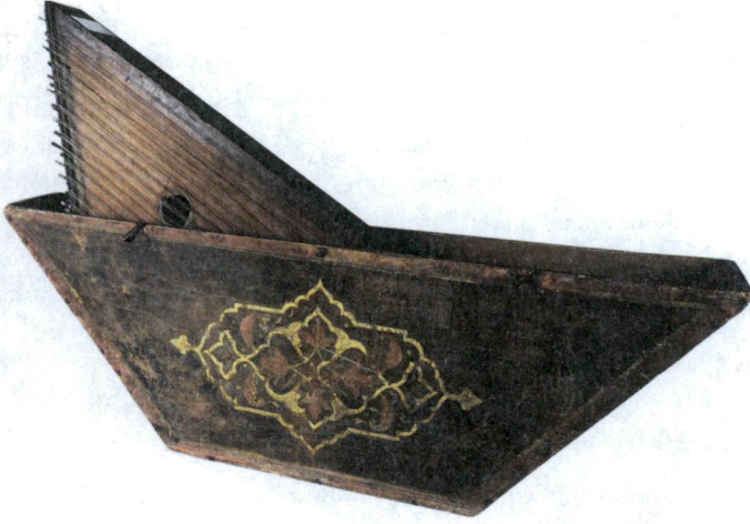
Fotoğraf 2. İbrahim Hakki'nın oğlu İsmail Fehim'e ait Santur ve Santur kabı

Akpınar, “İbrahim Hakki’da Musiki Düşüncesi” adlı çalışmasında şu görüşlere yer vermiştir; “Hanımı için besteler yaparak onunla birlikte icra eden İbrahim Hakki’nın musikinin pratiğine de karşı olmadığını görürüz. Oğlu İsmail Fehim’in musikişinas ve sazende olması, İbrahim Hakki’nın musiki konusundaki düşünce yapısını anlamamıza ışık tutmaktadır” 51 .