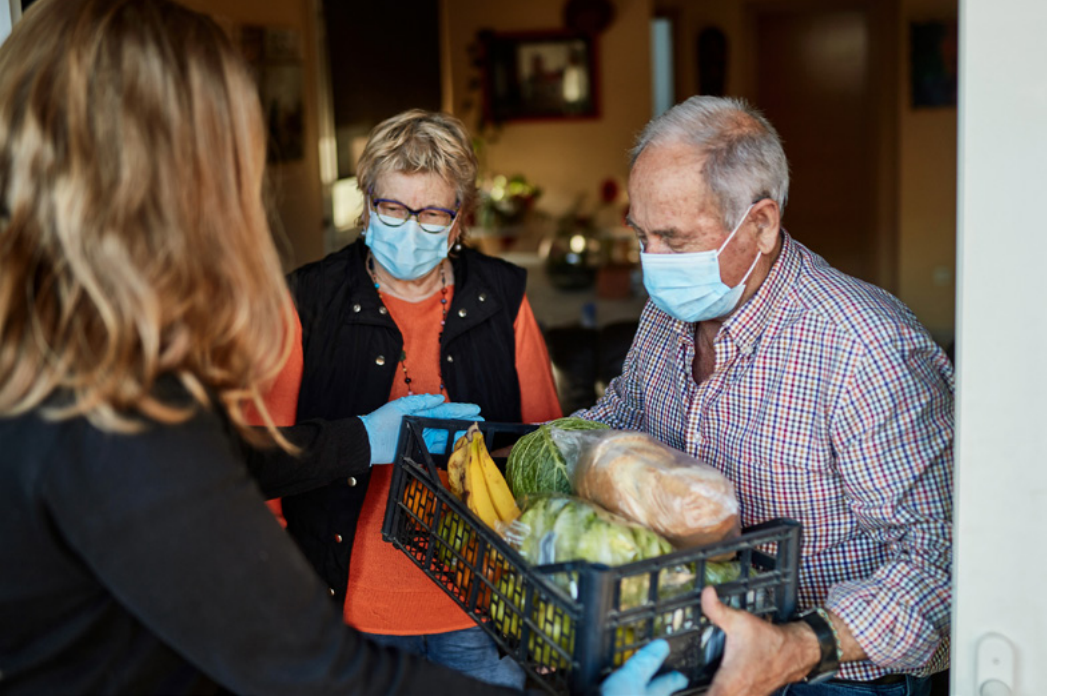
Salgın sürecinde yardım