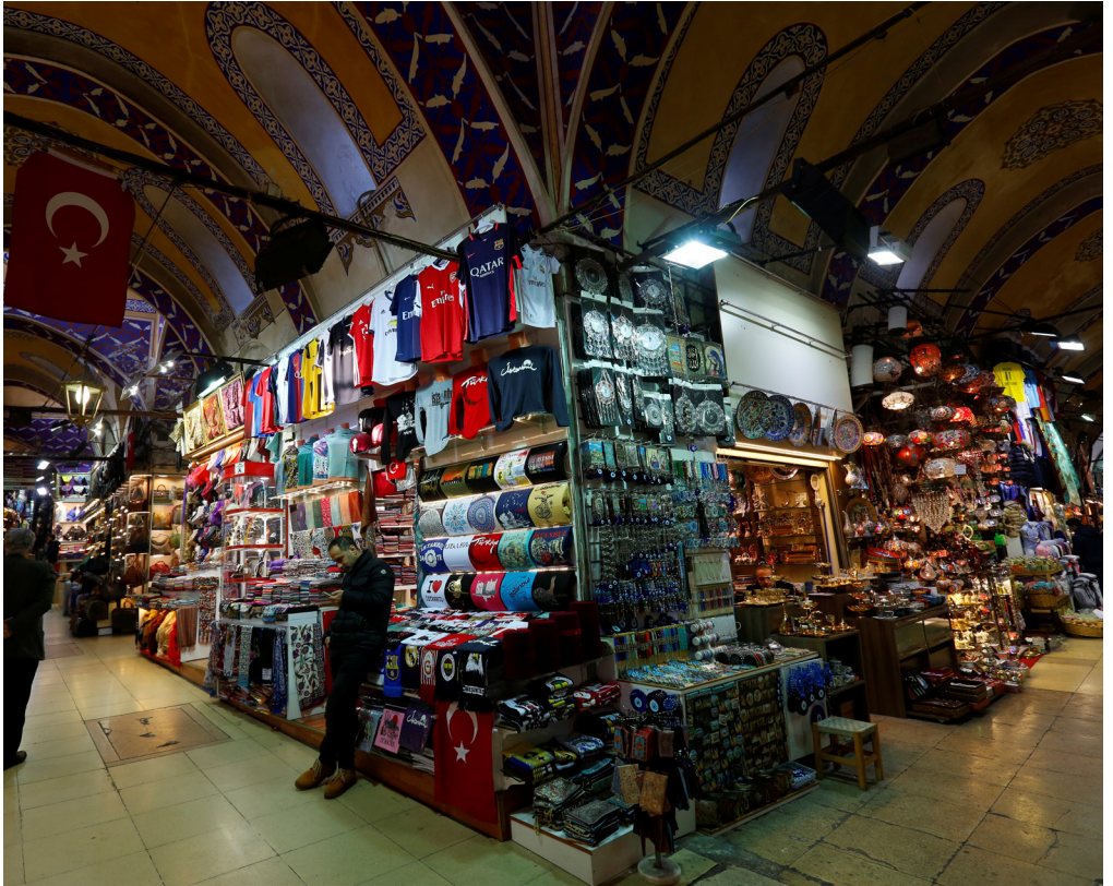
İstanbul/ Kapalıçarşı