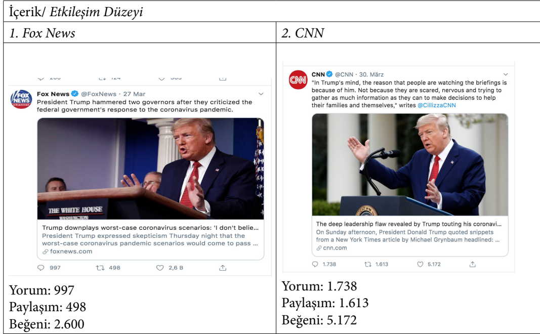
Tablo 2. CNN ve Fox News’in Twitter Sayfalarında Covid-19 Salgınında Hükümet Çalışmaları Konulu En Yüksek Etkileşim Düzeyine Sahip İletiler (Mart)

CNN ve Fox News TV kanallarının, Twitter’da Mart ve Nisan aylarında Covid-19 salgını konulu ve en yüksek etkileşim düzeyine sahip içerikleri, eleştirel söylem analizi yöntemi ile incelenmiştir.