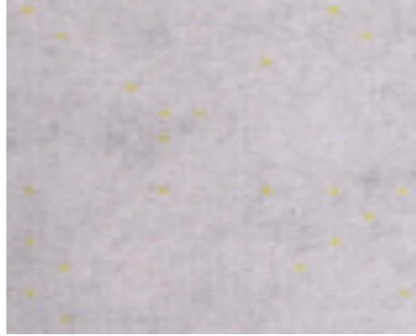
Resim 1: Sarı Noktaların Evrak Üzerinde Yakın Çekim Görünümü (URL-2)

SKS kodları cihaz ve evrak hakkında bize bilgi veren bir sistemdir. Bu sistem evrak içerisine fiziksel filigran veya fiziksel steganografi örneği olarak sarı noktalardan oluşan bir desen olarak işlenmektedir. Bu noktalar çıplak insan gözü ile görülmesinin zor ve hatta imkânsız olması için sarı renklerde ve ufak boyutlarda üretilmektedir. Her biri 0.006 inç olan bu sarı noktalar 600 dpi çözünürlükte yaklaşık 4 piksellik bir boyuttadırlar (Beusekom vd 2010: 5). Renklerinin sarı olarak tercih edilmesinin sebebi beyaz arka plan renk üzerinde sarı rengin yansıtılabilirliğinin düşük olmasıdır. Bazı yazıcı modelleri sarı renk yerine mavi renkte noktalar da tercih etmektedirler. Tespit edilmiş sarı nokta içeren yazıcıların listesi ESV'nin internet sayfasından elde edilebilir (URL-3). Sarı noktaların evrak üzerinde nasıl görüldüğü hakkında bilgi sahibi olunması amacıyla Şekil1'de sarı nokta işlenmiş bir evrak görüntüsü paylaşılmıştır.