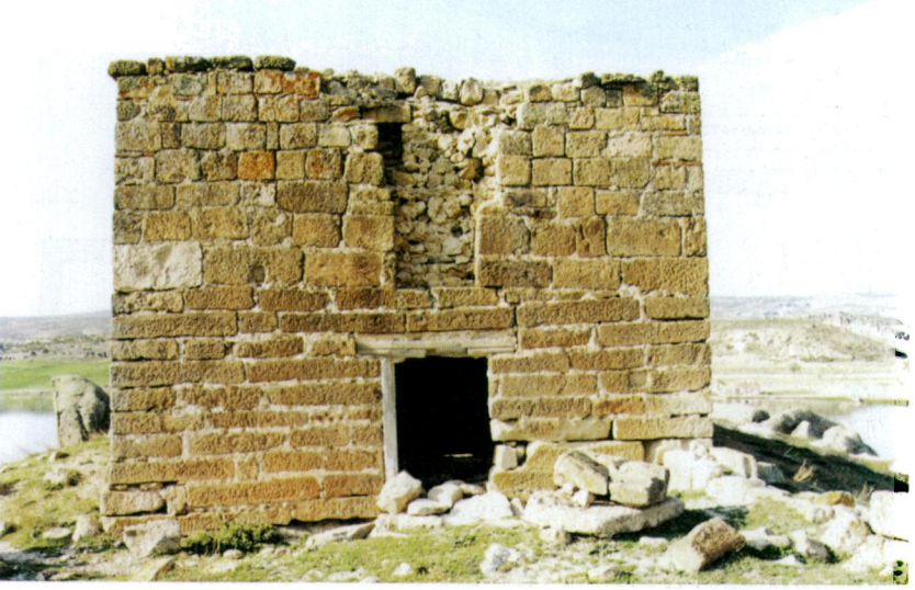
Resim 3 - Emre Sultan Türbesi'nin giriş cephesi