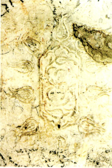
Resim 8 - Emre Sultan Türbesi'nin duvarlarındaki lalelerden detay - S.PARLAK