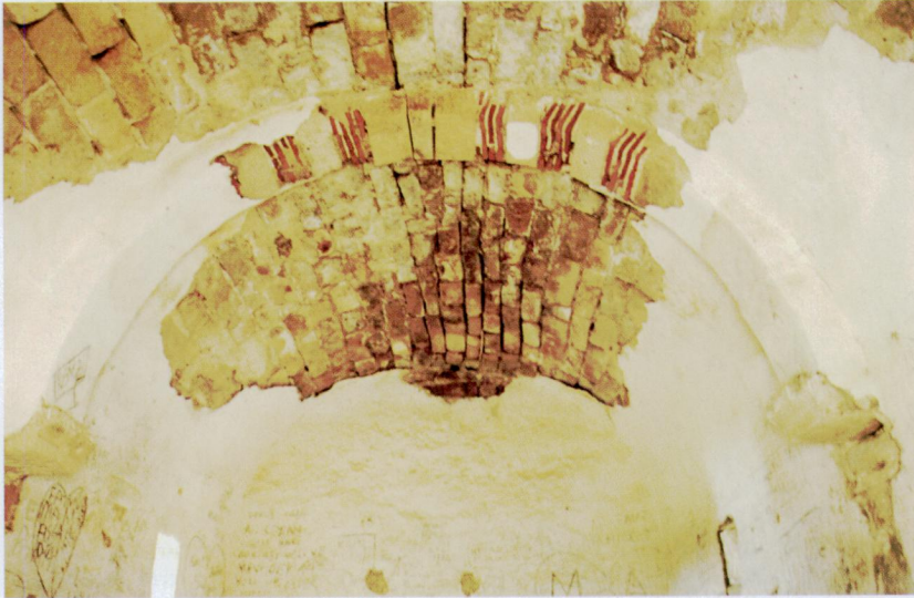
Resim 6 - Emre Sultan Türbesi'ni örten tonoz