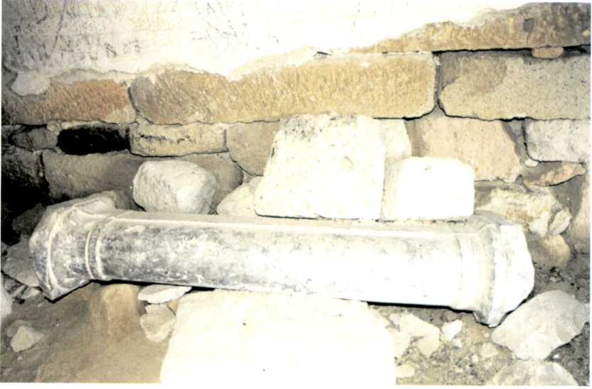
Resim 7 - Emre Sultan Türbesi'nin içindeki devşirme sütun - S.PARLAK