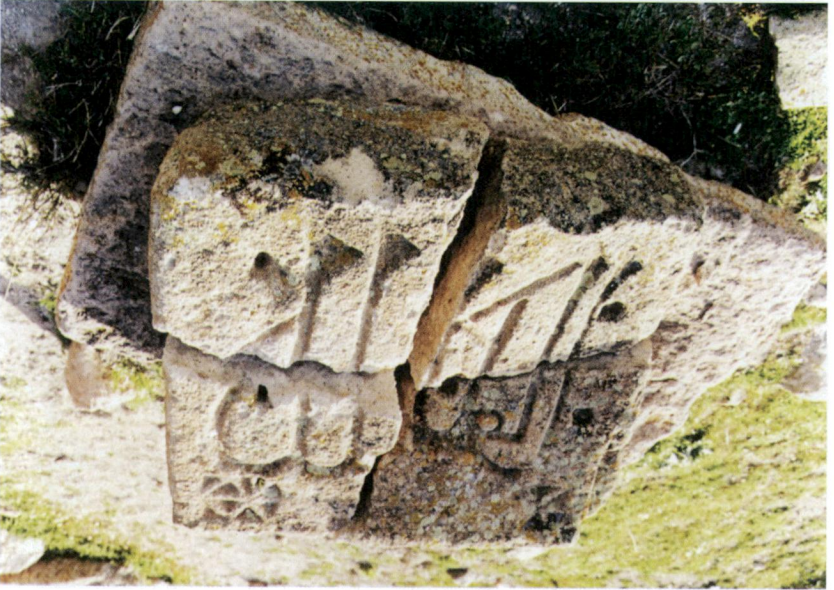
Resim 4 - Emre Sultan Türbesi'nin giriş cephesinden düşen yazılı taş - S. PARLAK