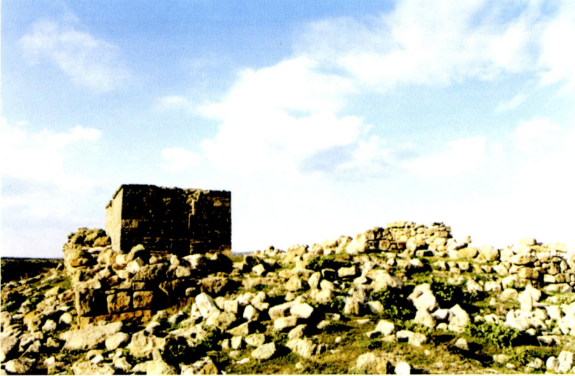
Resim 2 - Emre Sultan Zâviye ve Türbesi'nin genel görünüşü - S. PARLAK