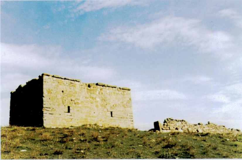
Resim 5 - Emre Sultan Türbesi'nin kuzey ve batı cepheleri - S.PARLAK